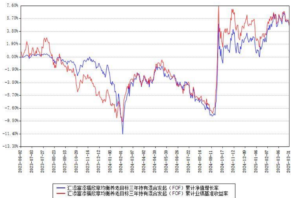
汇添富添福欣享均衡养老目标三年持有混合发起（FOF）累计净值增长率与同期业绩基准收益率对比图