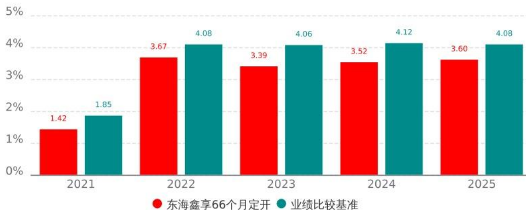
基金的过往业绩不代表未来表现，数据截止日：2025年12月31日

本基金合同于 2021 年 7 月 19 日生效，合同生效当年按实际存续期计算，不按整个自然年度进行折算。业绩表现截止日期 2025 年 12 月 31 日。基金过往业绩不代表未来表现。