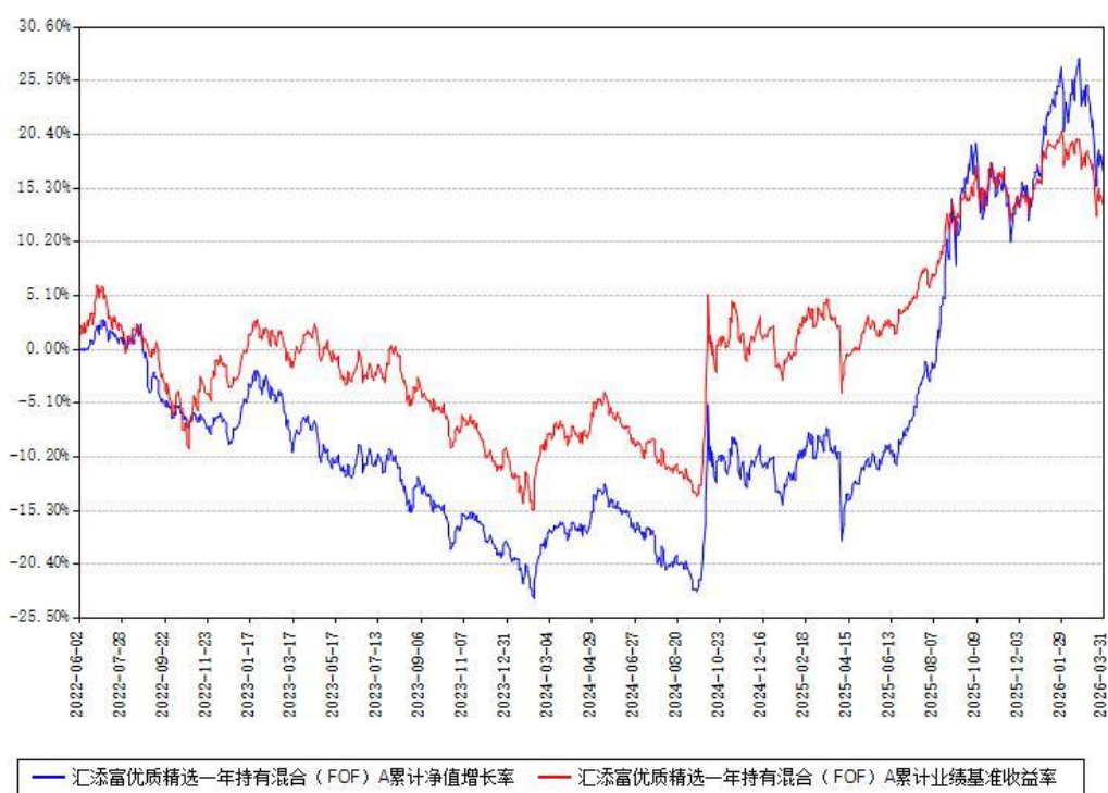
汇添富优质精选一年持有混合（FOF）A累计净值增长率与同期业绩基准收益率对比图