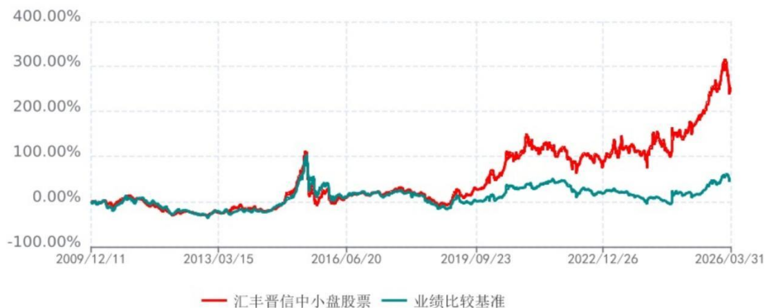
汇丰晋信中小盘股票累计净值增长率与业绩比较基准收益率历史走势对比图 (2009年12月11日-2026年03月31日)

注：1. 按照基金合同的约定，本基金的股票投资比例范围为基金资产的 85%-95%，其中，将不低于 80%的股票资产投资于国内 A 股市场上具有良好成长性和基本面良好的中小上市公司股票。本基金权证投资比例范围为基金资产净值的 0%-3%。本基金固定收益类证券和现金投资比例范围为基金资产的 5%-15%，其中现金（不包括结算备付金、存出保证金、应收申购款等）或到期日在一年以内的政府债券的投资比例不低于基金资产净值的 5%。按照基金合同的约定，本基金自基金合同生效日起不超过 6 个月内完成建仓，截止 2010 年 6 月 11 日，本基金的各项投资比例已达到基金合同约定的比例。