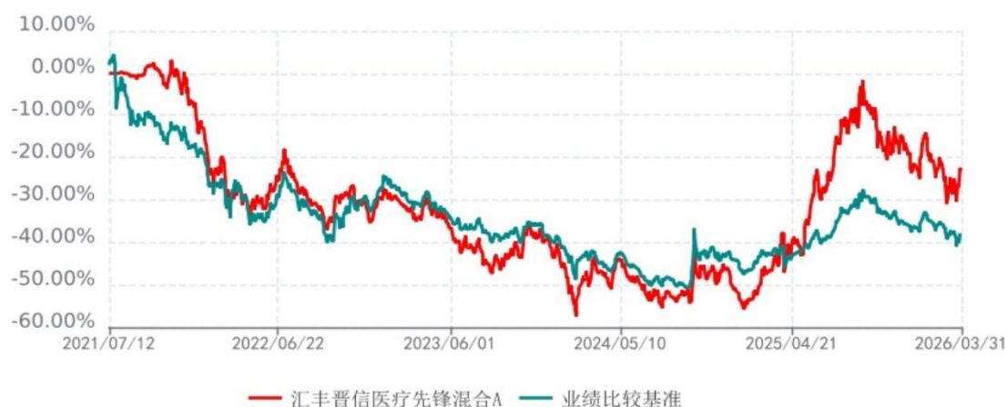
汇丰晋信医疗先锋混合A累计净值增长率与业绩比较基准收益率历史走势对比图 (2021年07月12日-2026年03月31日)