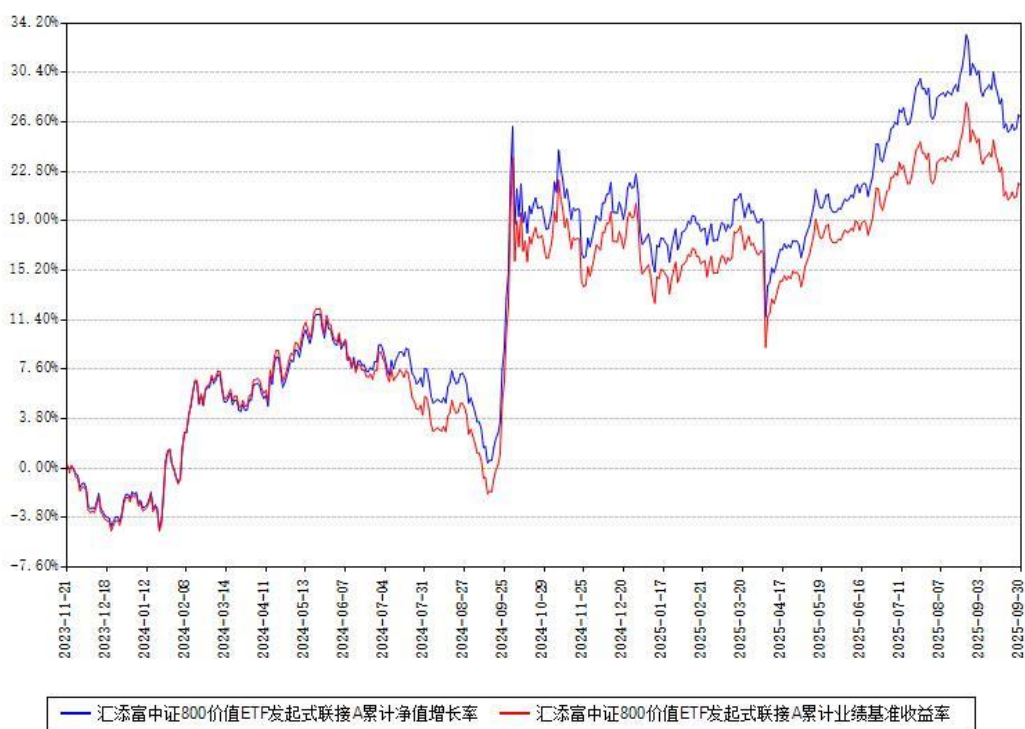
汇添富中证800价值ETF发起式联接A累计净值增长率与同期业绩基准收益率对比图

（二）自基金合同生效以来基金累计净值增长率变动及其与同期业绩比较基准收益率变动的比较图