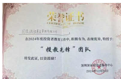
国投瑞银被深证投服中心授予“投教先锋”团队称号