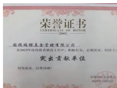
国投瑞银获得深圳市证券业协会“优秀投资者教育基地”和“突出贡献单位”证书