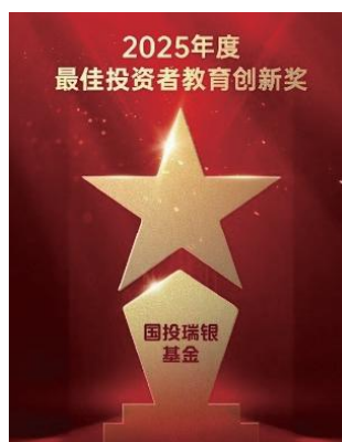
国投瑞银获得新浪财经“最佳投资者教育创新奖”