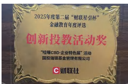
国投瑞银获得“财联社星引杯·创新投教活动奖”

国投瑞银基金投教作品全年播放量超1,000万，并荣获“优秀投资者教育基地”“创新投教活动奖”等行业奖项，多篇原创图文被监管部门及主流财经平台转载表扬。