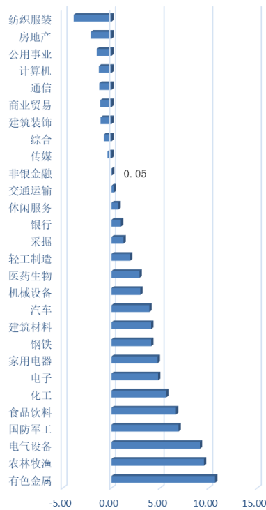
图 1：申万一级行业涨跌幅对比 (%)