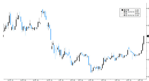
吉祥航空 參考數據