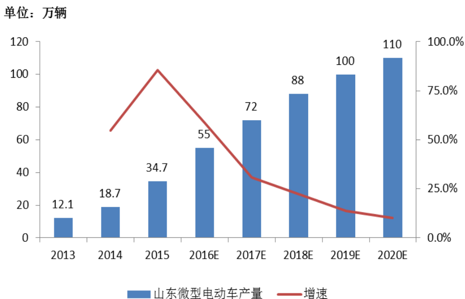
图 1: 2020 年山东省微型电动车产量有望突破 100 万辆

外延发展切入微型电动车领域。 公司2015年7月出资1.77亿元购买山东丽驰新能源汽车有限公司原有股东股份, 并对山东丽驰增资1.5亿元。该次交易完成后公司共计持有山东丽驰51%的股份, 实现控股。山东丽驰在微型电动车产品上具有较强的自主研发与生产能力, 目前具备7大产品平台、13个系列和22款产品。报告期内山东丽驰实现微型电动车销量2.22万辆, 同比增长51.2%, 实现销售收入4.21亿元, 同比增长33.9%, 为公司贡献了1705.44万元净利润。2012年山东省《加快发展节能与新能源汽车产业的实施意见》指出到2020年全省低速电动车生产规模目标100万辆, 微型电动车发展趋势长期向好。近期, 我国首部《微型低速电动车技术条件》团体标准正式实施, 微型电动车迎来行业规范。我们认为该产业的准入资质将会日趋严格, 拥有核心技术和生产能力的企业具有竞争优势。公司通过外延发展的方式, 切入微型电动车产业领域, 实现竞争卡位, 未来有望受益于行业的快速发展。