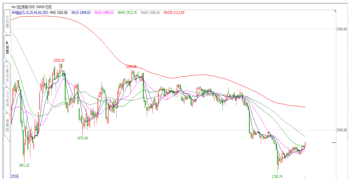
图 4：创业板指走势图