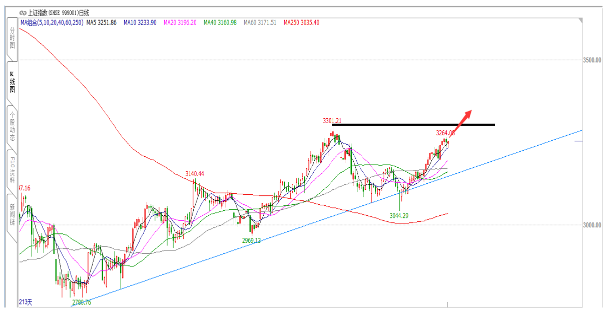
图 3：上证综指走势图