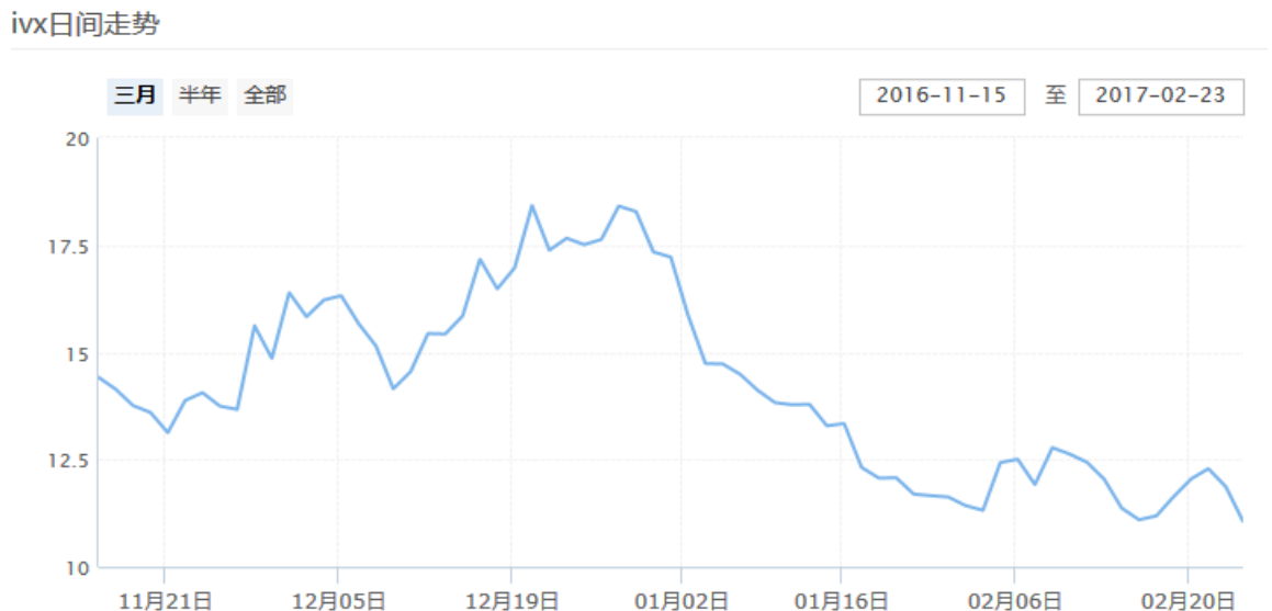
图表 9：中国波指的日间走势（最近三个月）