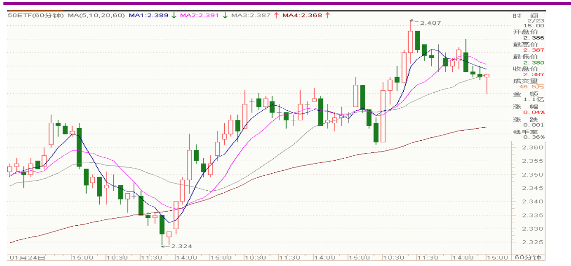
图表 1: 上证 50ETF60 分钟 K 线图

周四, 50ETF 震荡下行, 收于 2.387, 跌 0.009, 跌幅为 0.38%。全天成交金额 3.5 亿。