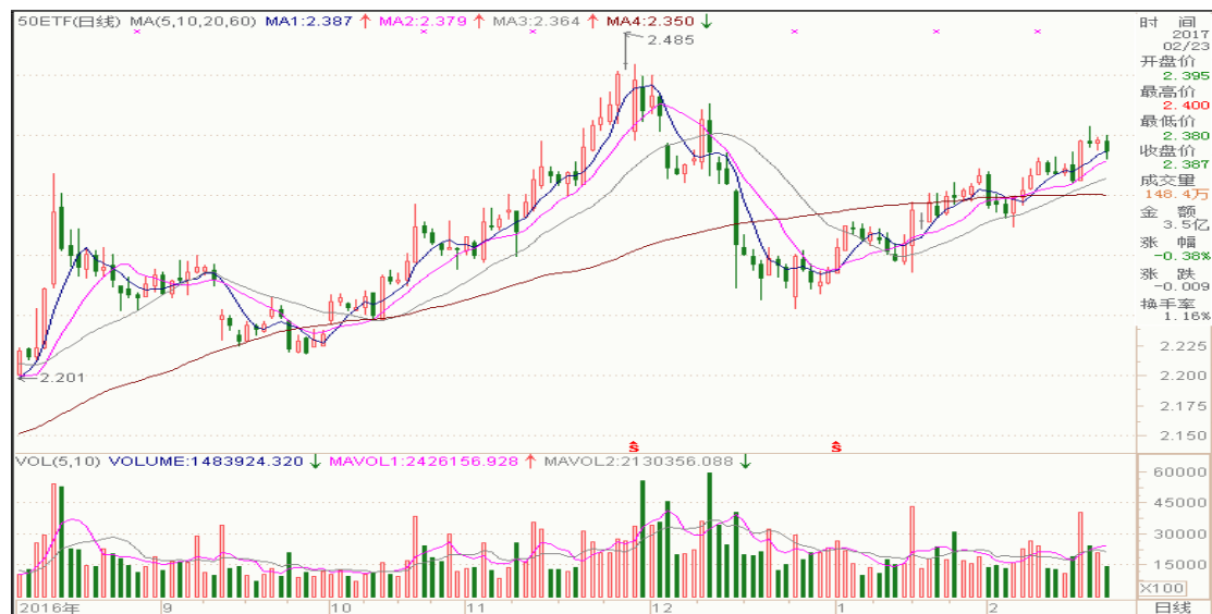
图表 2：上证 50ETF 日 K 线图