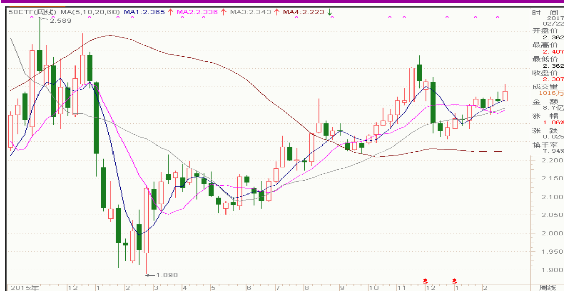
图表 3：上证 50ETF 周 K 线图