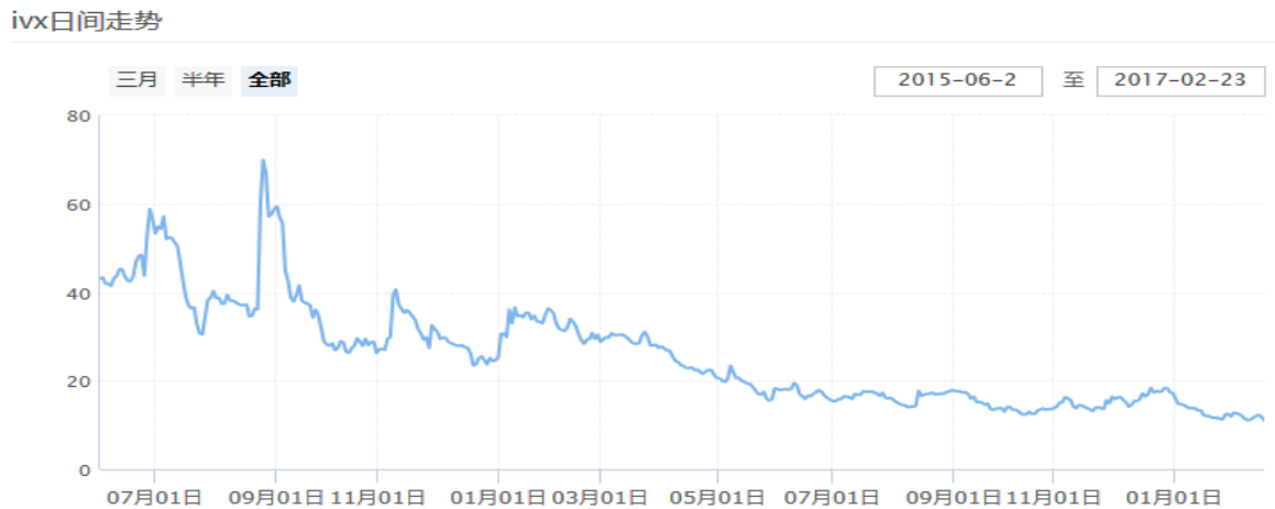
图表 8：中国波指的日间走势（全部）