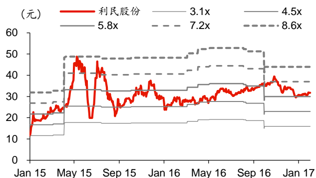
图表2: 利民股份历史 PB-Bands