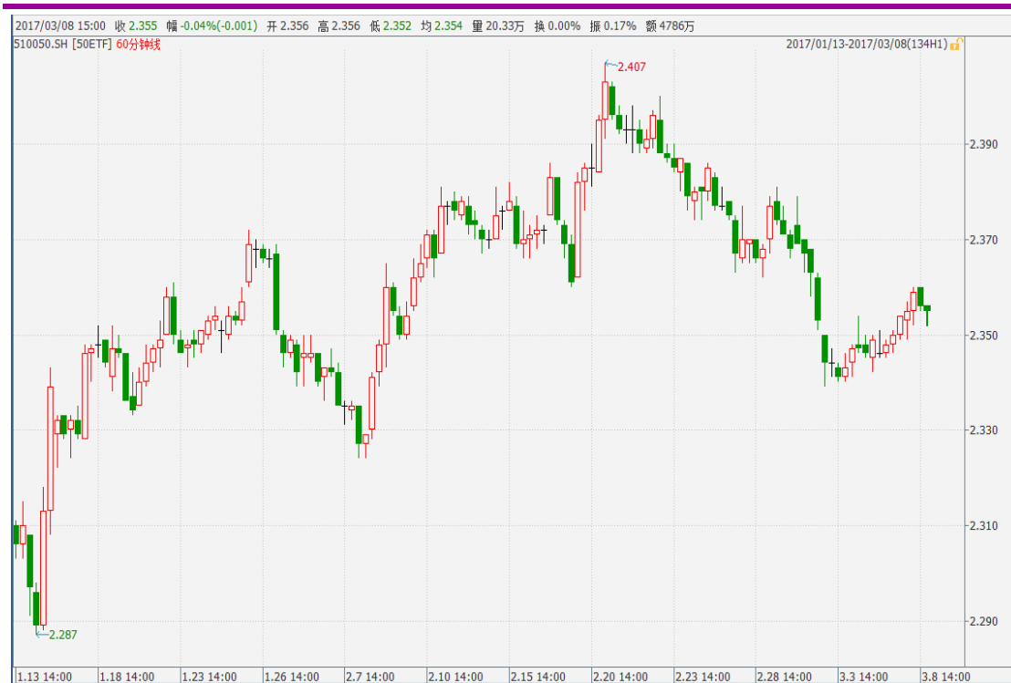
图表 1：上证 50ETF60 分钟 K 线图

周三，50ETF 微升，收于 2.355，上涨 0.001，涨幅为 0.04%，全天成交金额 2.66 亿。