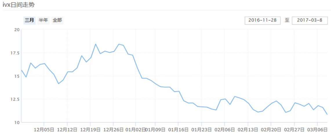
图表 11：中国波指的日间走势（最近三个月）