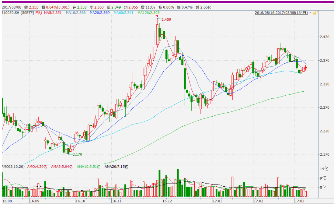
图表 2：上证 50ETF 日 K 线图