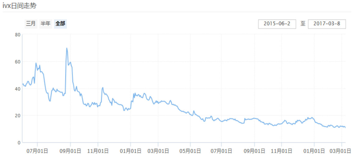
图表 10：中国波指的日间走势（全部）