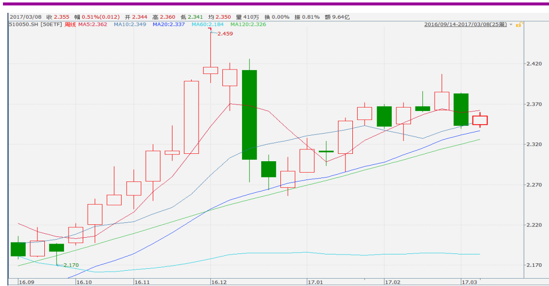
图表 3：上证 50ETF 周 K 线图