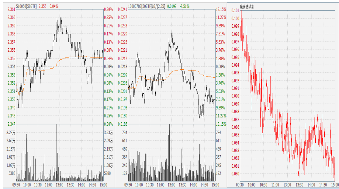
图表 7：50ETF 与 3 月平值认购期权“50ETF 购 3 月 2350” 日内走势图及隐含波动率走势图