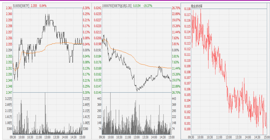
图表 8：50ETF 与 3 月平值认沽期权“50ETF 沽 3 月 2350” 日内走势图及隐含波动率走势图