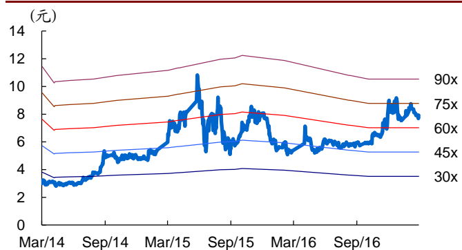
图 1: 红旗连锁历史 PE Band