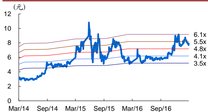
图 2: 红旗连锁历史 PB Band