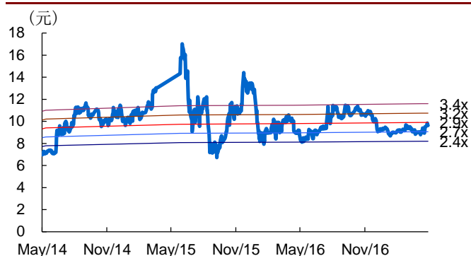
图 2：方大炭素历史 PB Band