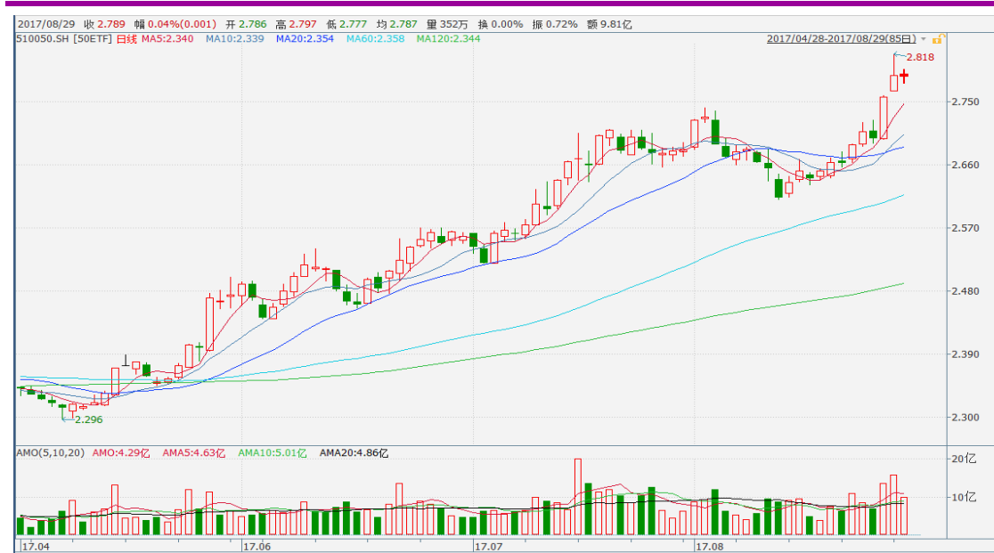
图表 2：上证 50ETF 日 K 线图