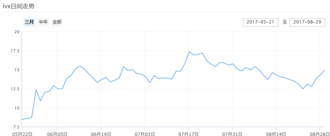
图表 12：中国波指的日间走势（最近三个月）