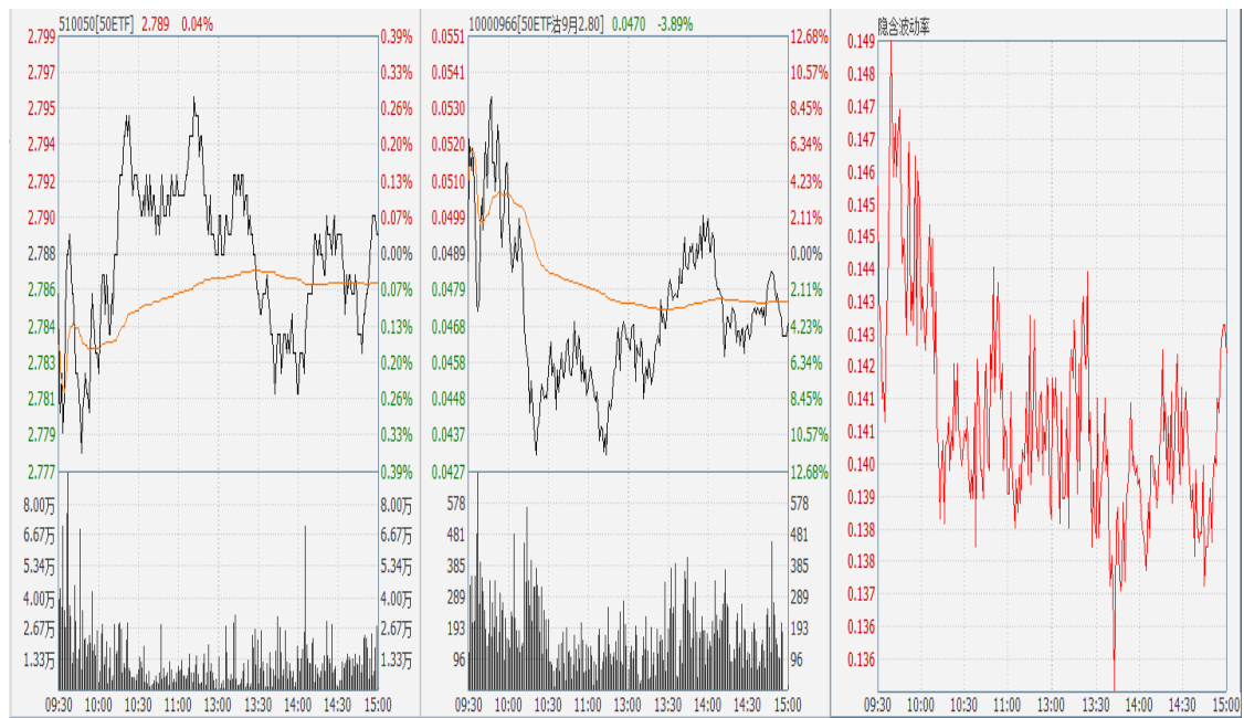
图表 9：50ETF 与 9 月平值认沽期权 “50ETF 沽 9 月 2800” 日内走势图及隐含波动率走势图