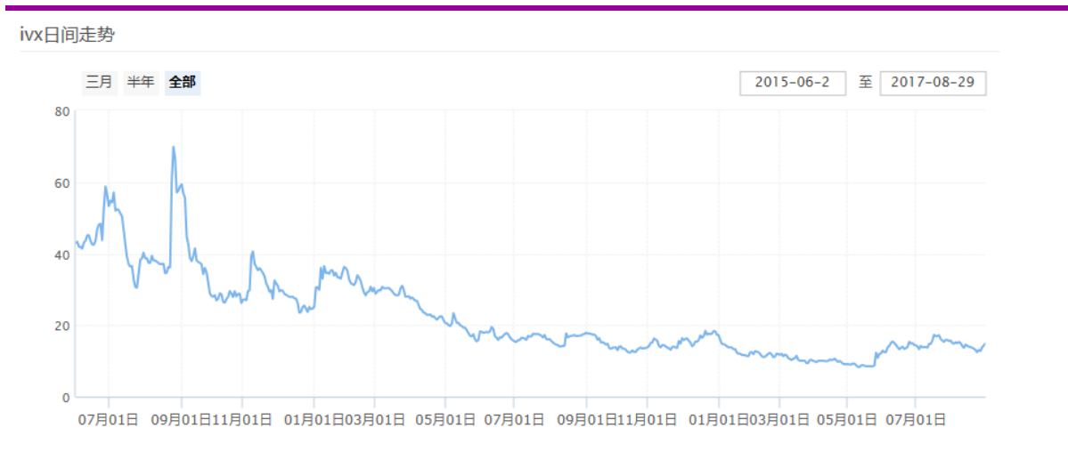
图表 11：中国波指的日间走势（全部）