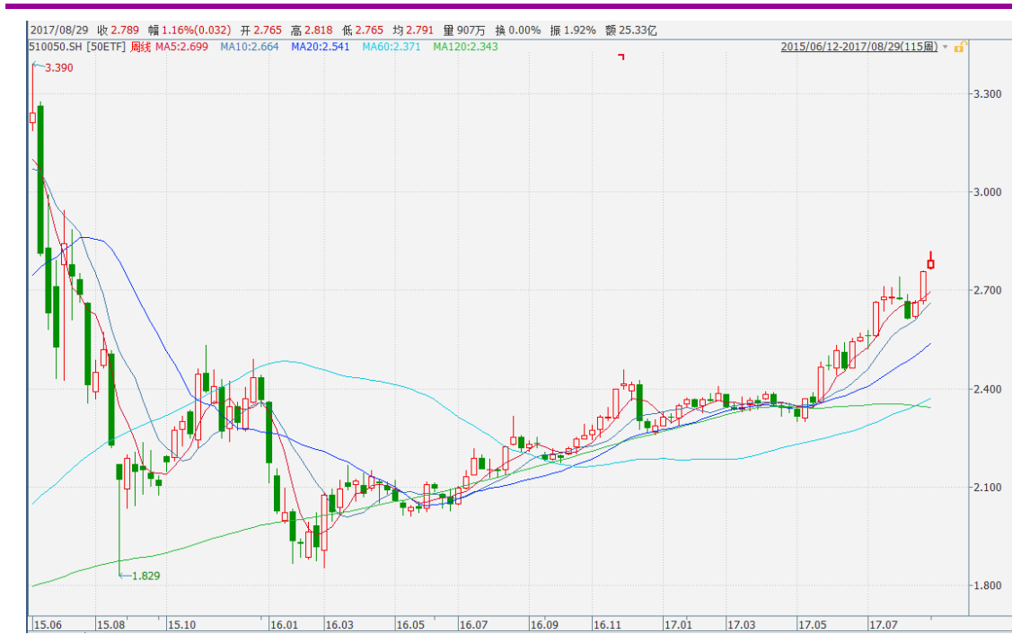
图表 3：上证 50ETF 周 K 线图