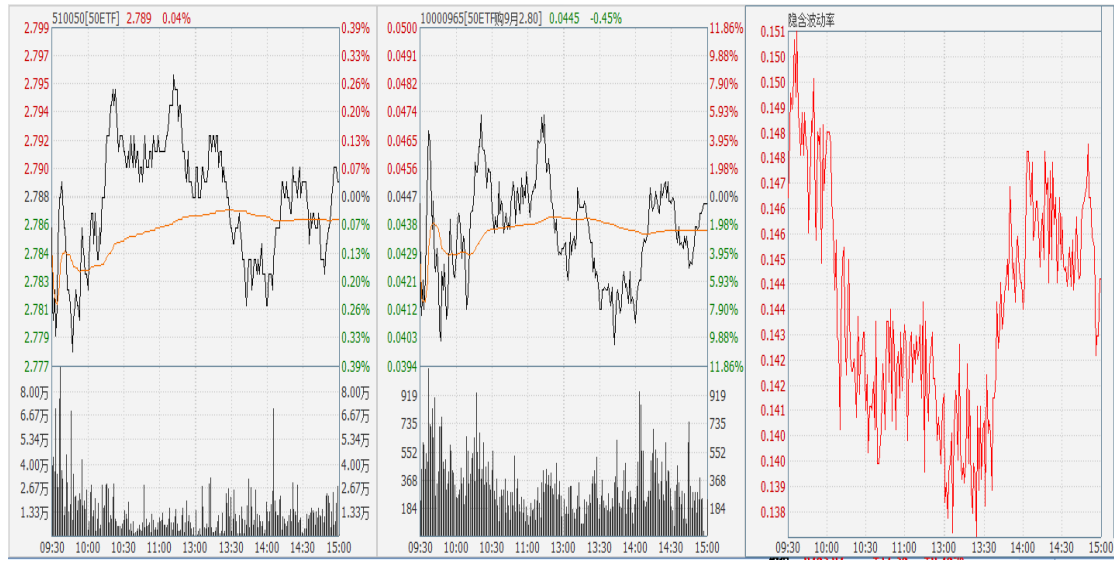
图表 8：50ETF 与 9 月平值认购期权 “50ETF 购 9 月 2800” 日内走势图及隐含波动率走势图