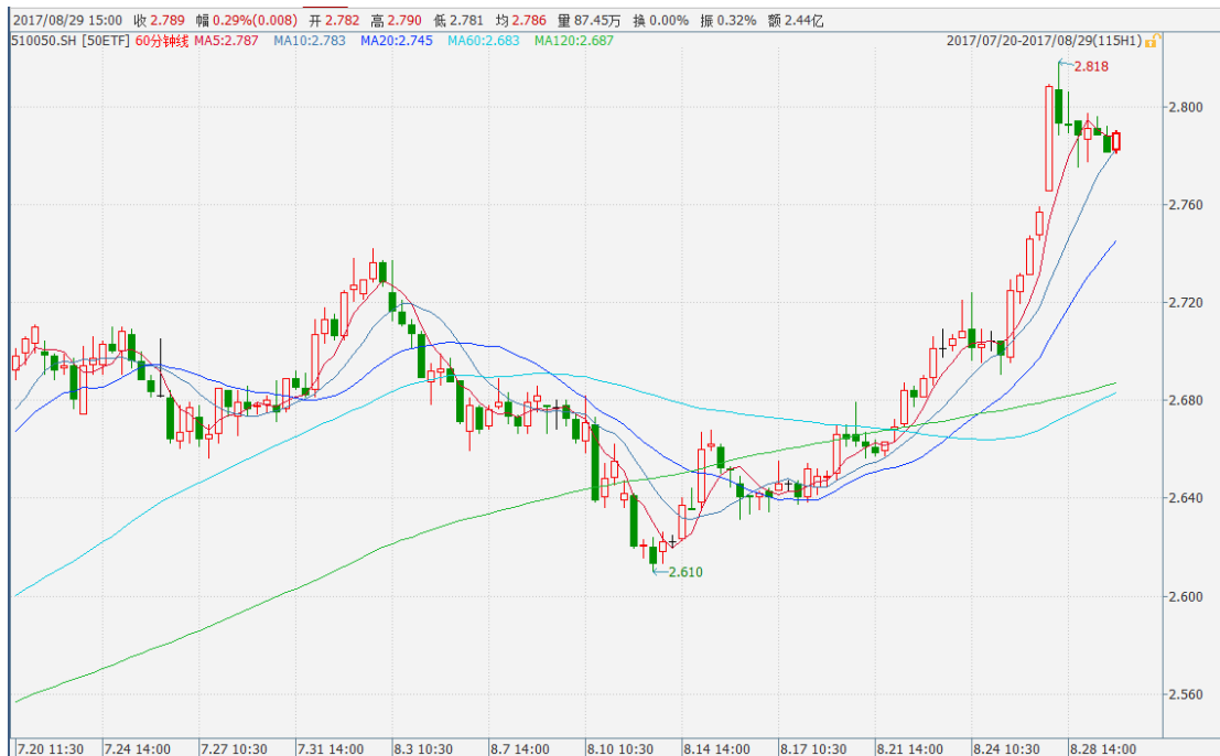
图表 1：上证 50ETF60 分钟 K 线图

从下面的 60 分钟图来看，50ETF 维持小幅波动的行情，总体震荡上行的格局未改。