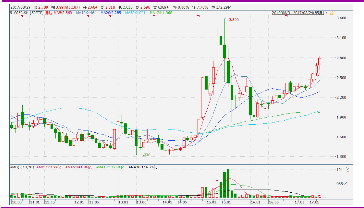
图表 4：上证 50ETF 月 K 线图

从以下的月 K 线图看，本轮反弹行情延续性有所增强，成交金额较 2014 年四季度至 2015 年的牛市相比明显降低。