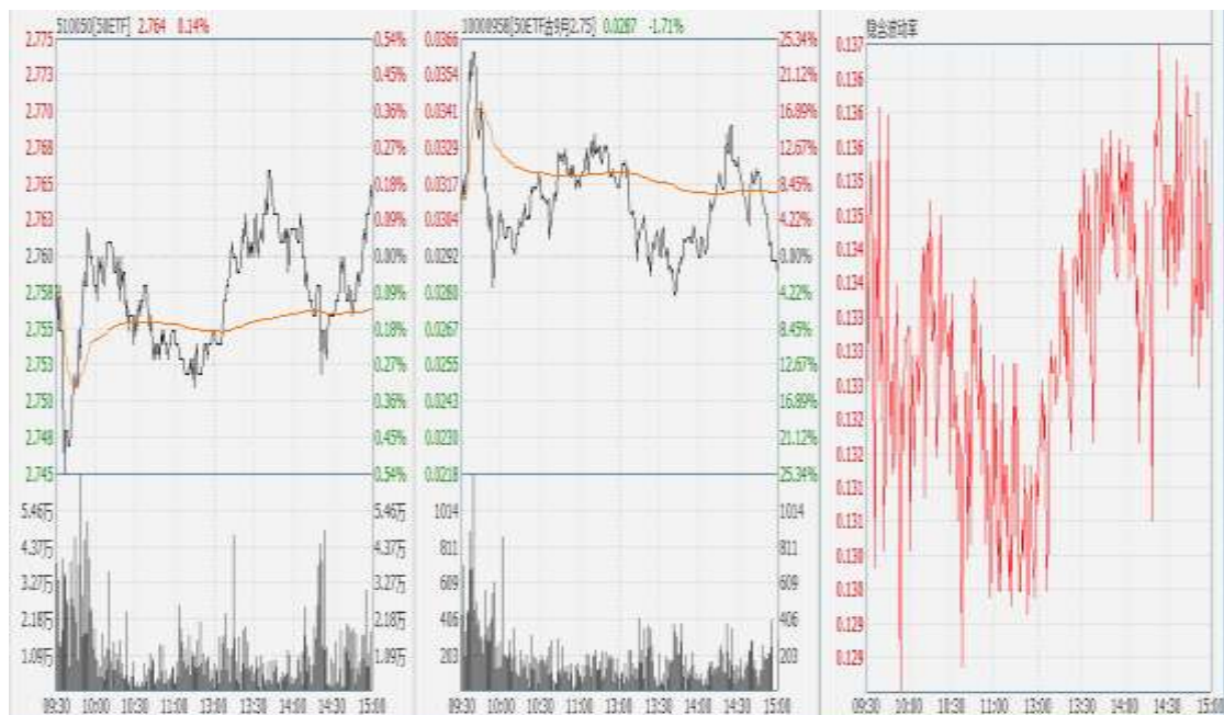
图表 9：50ETF 与 9 月平值认沽期权“50ETF 沽 9 月 2750” 日内走势图及隐含波动率走势图