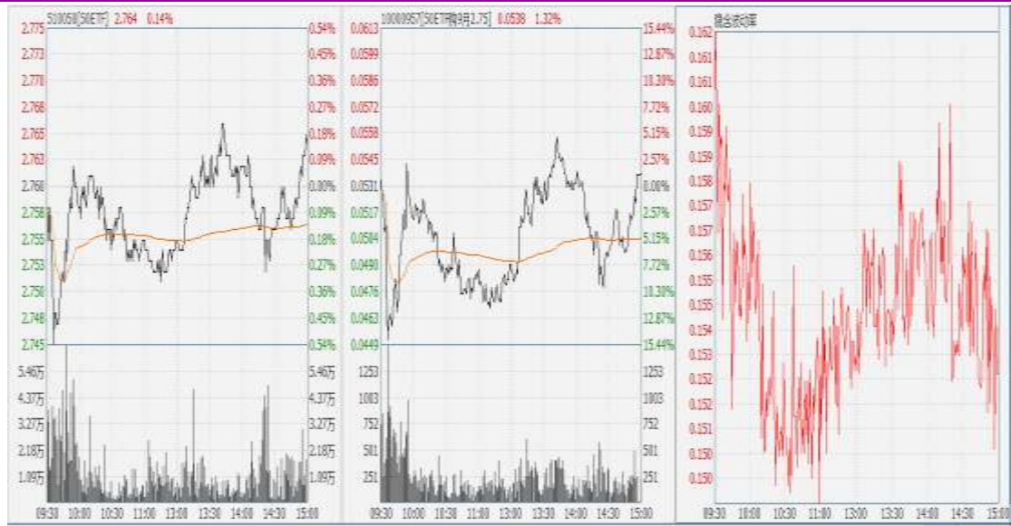
图表 8：50ETF 与 9 月平值认购期权“50ETF 购 9 月 2750” 日内走势图及隐含波动率走势图