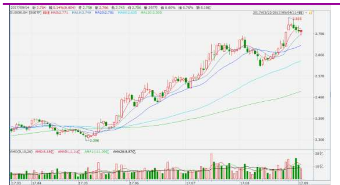
图表 2：上证 50ETF 日 K 线图

从下面的日 K 线图来看，50ETF 连续下跌后在 10 日均线附近获得一定支撑。