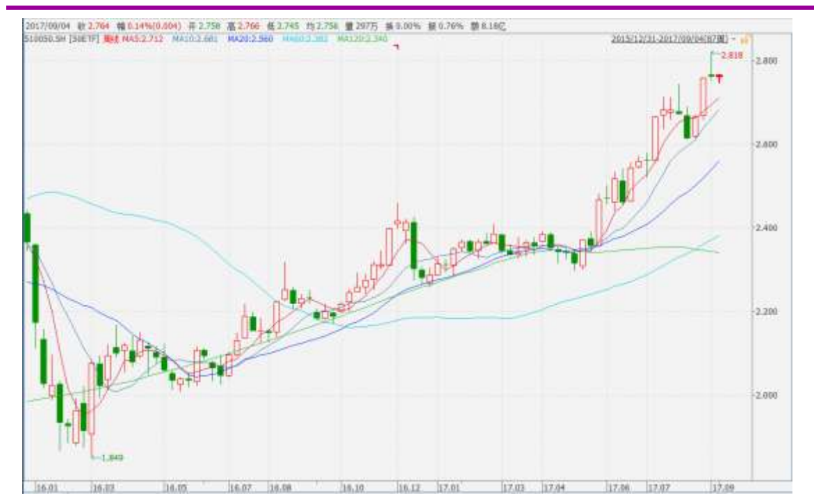
图表 3：上证 50ETF 周 K 线图