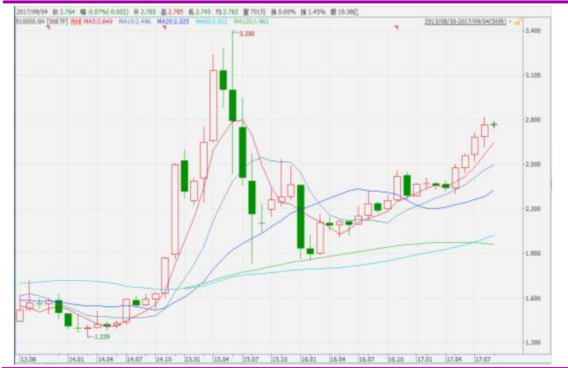
图表 4：上证 50ETF 月 K 线图