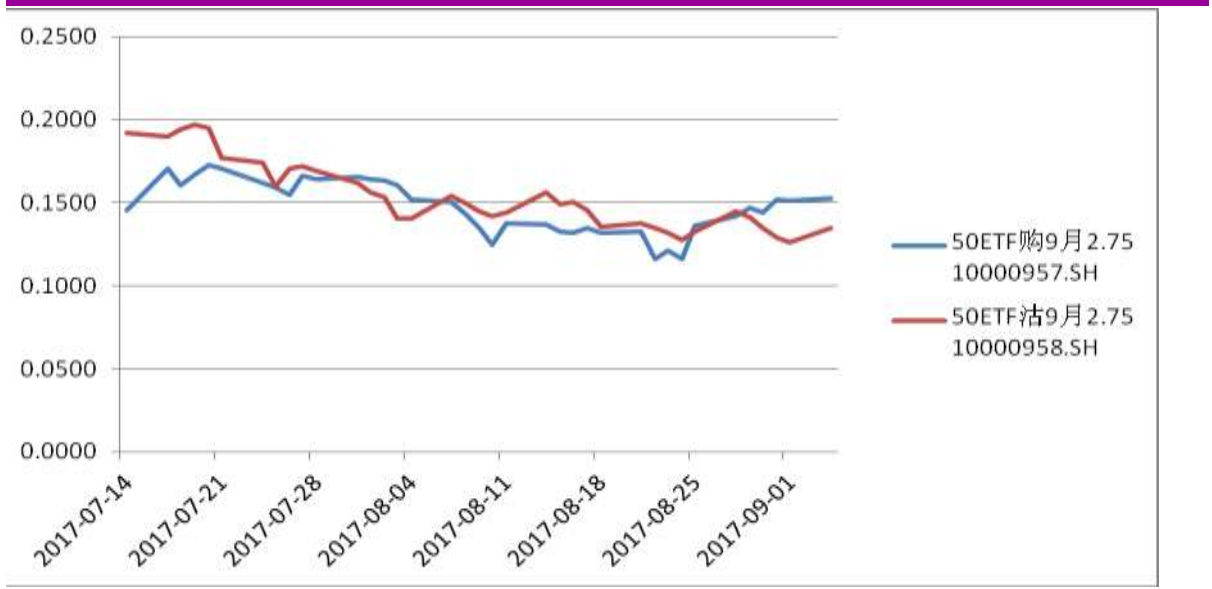
图表 10：9 月平值认购期权与平值认沽期权隐含波动率变化图 ( 50ETF 购 9 月 2750 ) VS ( 50ETF 沽 9 月 2750 )

9 月平值认购期权合约“50ETF 购 9 月 2750”隐含波动率为 15.28%；9 月平值认沽期权合约“50ETF 沽 9 月 2750”隐含波动率为 13.48%。