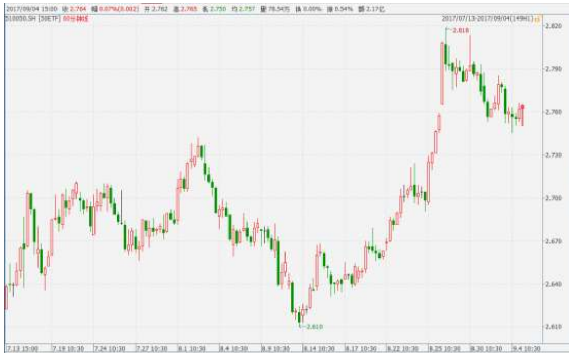
图表 1：上证 50ETF60 分钟 K 线图