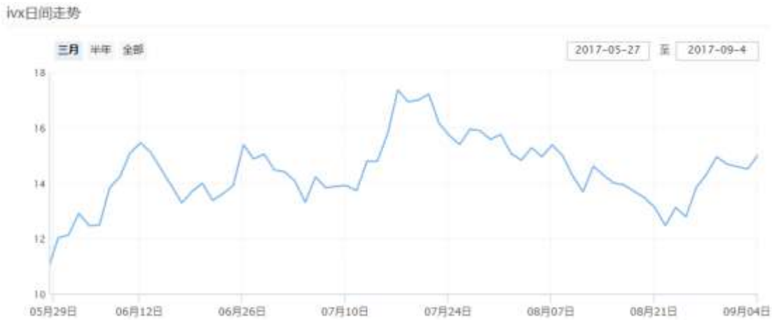
图表 12：中国波指的日间走势（最近三个月）