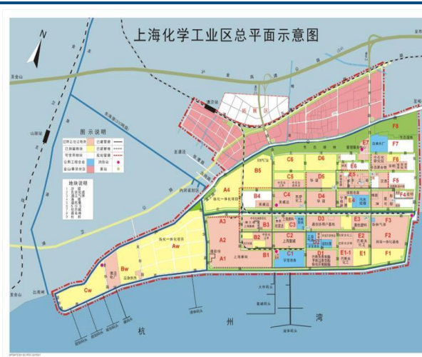
图2：上海化学工业区总平面示意图