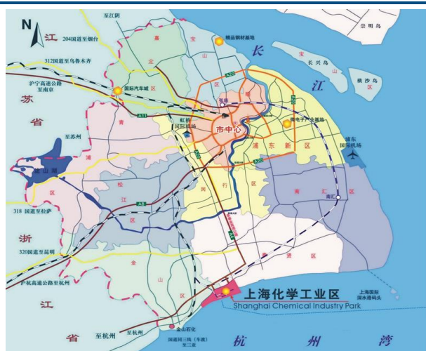
图1：上海化学工业区地理位置

上海化学工业区为国家级经济技术开发区，是国家首批新型工业化示范基地、国家生态工业示范园区、全国循环经济先进单位。园区位于杭州湾北岸，规划面积 29.4 平方公里，是以炼化一体化项目为龙头，打造“1+4”产业组合，发展以烯烃和芳烃为原料的中下游石油化工装置以及精细化工深加工系列，形成乙烯、丙烯、碳四、芳烃为原料的产品链。上海化工区是“十五”期间中国投资规模最大的工业项目之一，第一期项目总投资将达 1500 亿元人民币，是中国改革开放以来第一个以石油和精细化工为主的专业开发区，同时也是上海六大产业基地的南块中心，被誉为“上海工业腾飞的新翅膀”。园区内知名石化企业众多，下图显示部分位于该园区的主要石化项目。