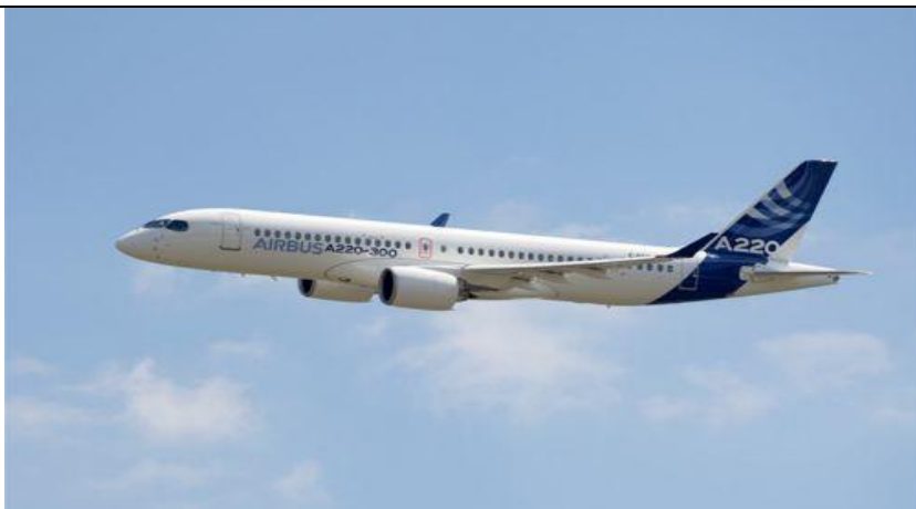
图 3：空中客车宣布推出 A220-100 与 A220-300 飞机

7 月 10 日，空中客在其位于图卢兹附近的亨利-齐格勒交付中心举行仪式，正式宣布推出 A220 系列飞机。在空客员工和全球新闻媒体的共同见证下，刚刚完成全新空中客车名称和涂装喷漆的 A220-300 飞机于当地时间 12 时 25 分飞抵图卢兹。