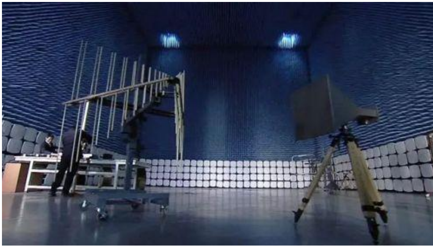
图 2：电磁兼容实验室内景