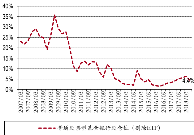
图表 1. 普通股票型基金银行股仓位 (剔除 ETF)