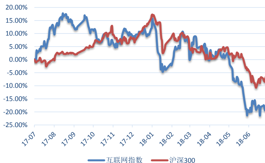
图表 2 近一年互联网指数及沪深 300 指数市场表现情况