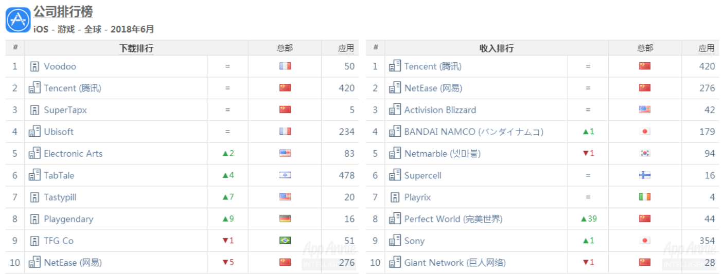
图5: IOS 平台游戏公司排行榜

公司方面, Voodoo 夺得下载榜榜首, 腾讯继续保持收入榜首, 下载下滑至第二。SuperTapx、Activision Blizzard 分列下载和收入榜第三。腾讯手游《绝地求生: 刺激战场》《王者荣耀》分别保持下载榜和收入榜榜首地位。