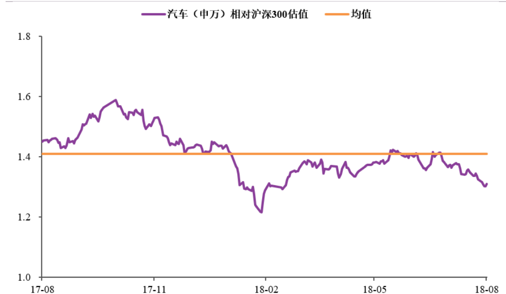
图表2： 汽车板块 PE(TTM)

本周汽车板块估值上升，板块整体为 15.32 (TTM)，相对沪深 300 比值为 1.31 倍。