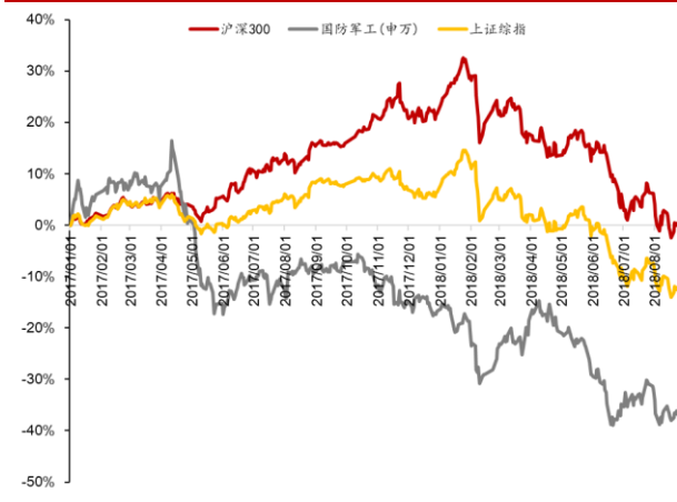
图 1：2017 年初至今板块市场表现

2018 年初至今，上证综指下跌 17.47%，沪深 300 下跌 17.50%，军工板块累计下跌 24.38%。2017 年初至今，军工板块累计下跌 36.97%。本周军工板块保持增长，本周累计上涨 1.70%，涨幅居 28 个子板块中第 8。