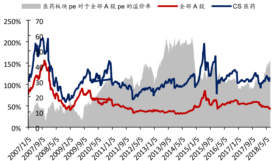
图 1: 医药板块和全部 A 股的预测市盈率及相对溢价率 (中信分行业分类)