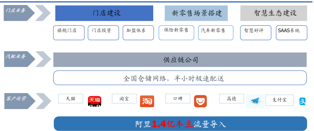
图表 5: 金固股份汽车后市场服务战略