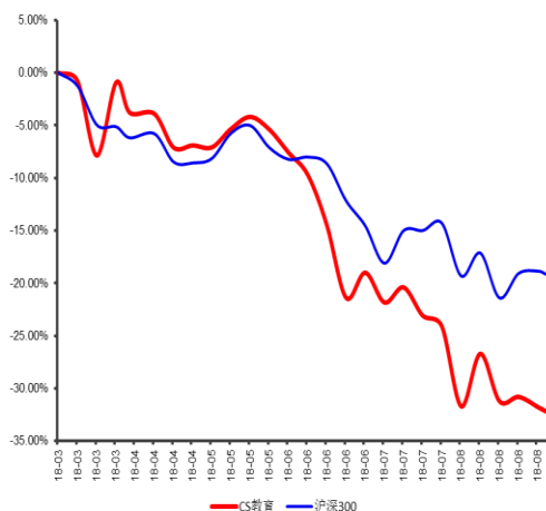
最近6个月行业指数与沪深300指数比较