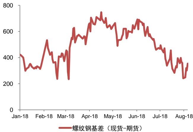
图表：螺纹基差监测