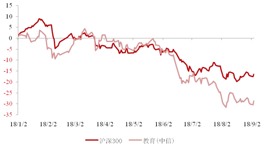
图表 1：教育行业表现（相对沪深 300 指数，2018 年以来）

上周，上证综指下跌-0.15%收 2725.25，深证成指下跌-0.23%收 8465.47，创业板指下跌-1.03%收 1435.20。沪深 300 上涨 0.28%收 3334.50，教育（中信）指数下跌-1.40%收 1042.85。