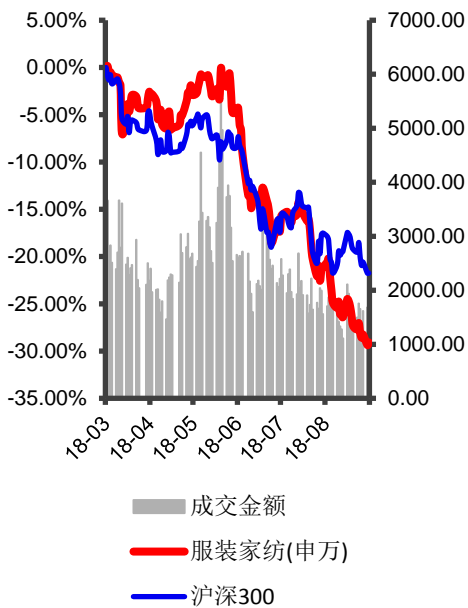
近 6 个月服装家纺指数和沪深 300 指数

从整个行业的运行来看，服装品牌企业收入和利润表现平稳增长，行业利润率水平小幅提高。因此对于服装家纺板块，我们建议关注业绩增长较为确定，运营效率持续提升的企业。