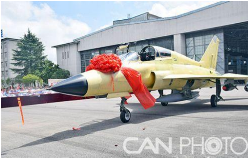
图 3：FTC-2000G 军贸飞机