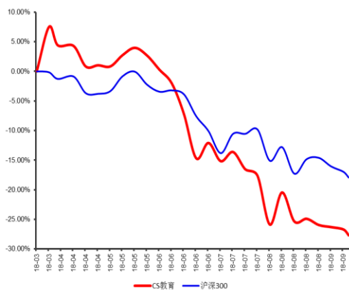
最近6个月行业指数与沪深300指数比较