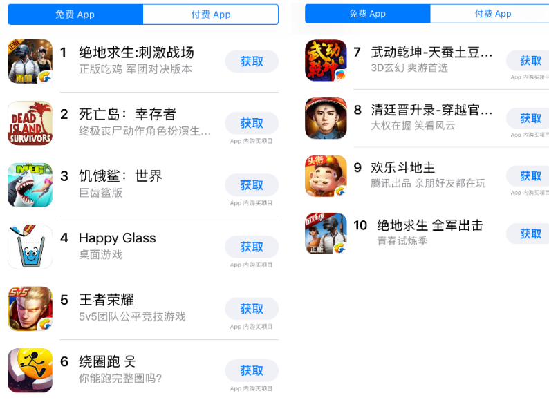
图表8： App Store 9 月 15 日数据中国区免费榜下载量排名前十

幸存者》、《饥饿鲨：世界》、《HAPPY GLASS》、腾讯出品的《王者荣耀》、《绕圈跑》、阿里出品的《武动乾坤-天蚕土豆正版授权》、《清廷晋升级-穿越官场模拟经营手游》、腾讯出品的《欢乐斗地主》、腾讯出品的《绝地求生 全军出击》。