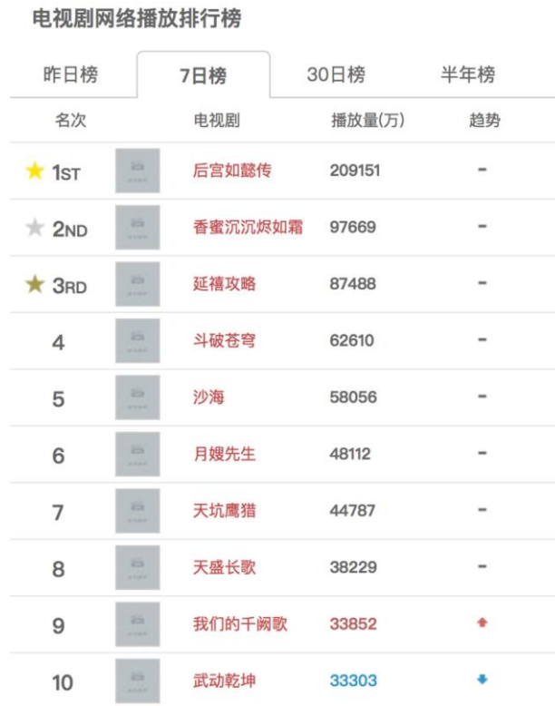
图表3：截至9月13日最近7日电视剧播放排行榜前十