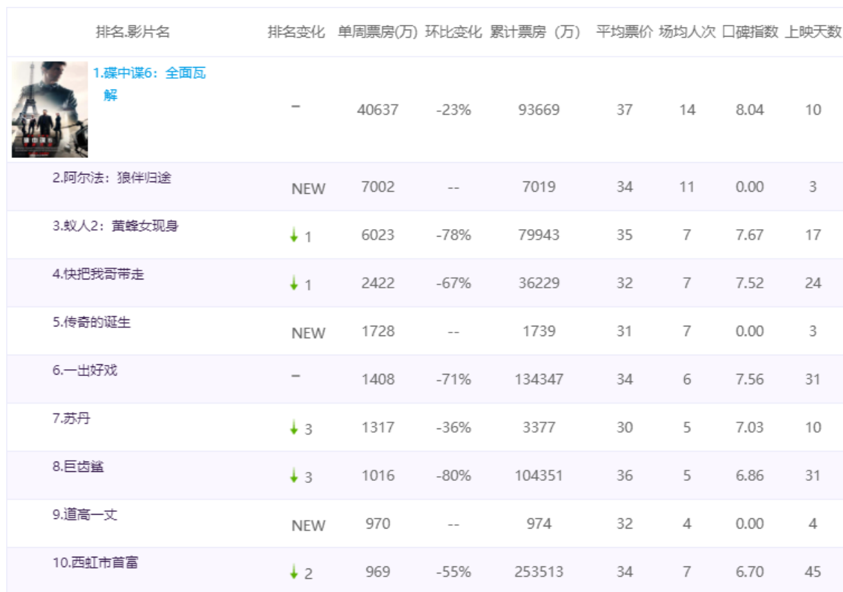
图表5： 2018年第36周（2018.9.03-2018.9.09）内地票房 TOP10