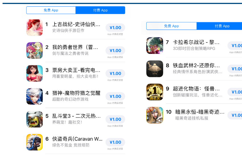
图表7：App Store 9 月 15 日数据中国区付费榜排名前十

App Store 9 月 15 日数据中国区付费榜排名前十：《上古战纪-史诗仙侠手游巨作》、《我的勇者世界（冒险版）》、《票房大卖王》、《猎神-魔物狩猎之觉醒》、《乱斗堂 3》、《侠盗奇兵》、《卡拉希尔战纪》、《铁血武林 2》、《超进化物语：怪兽小队再集结》、《暗黑永恒》。