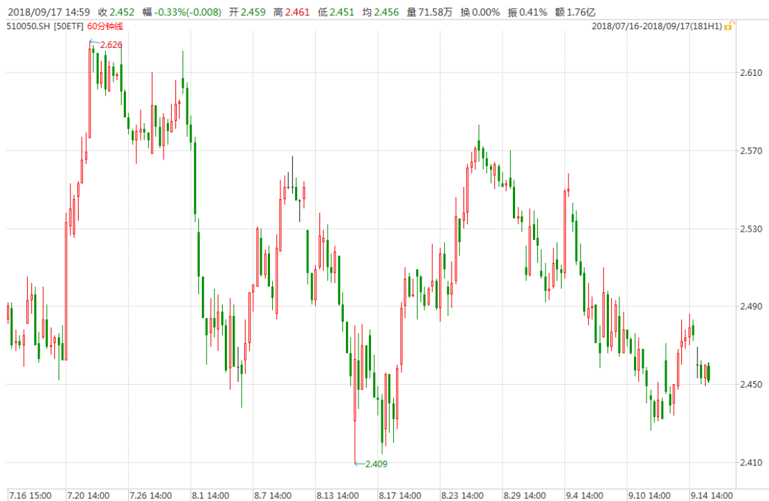
图表 1：上证 50ETF60 分钟 K 线图

从下面的 60 分钟图来看，50ETF 仍处于近期震荡区间波动，留意下档支撑位。