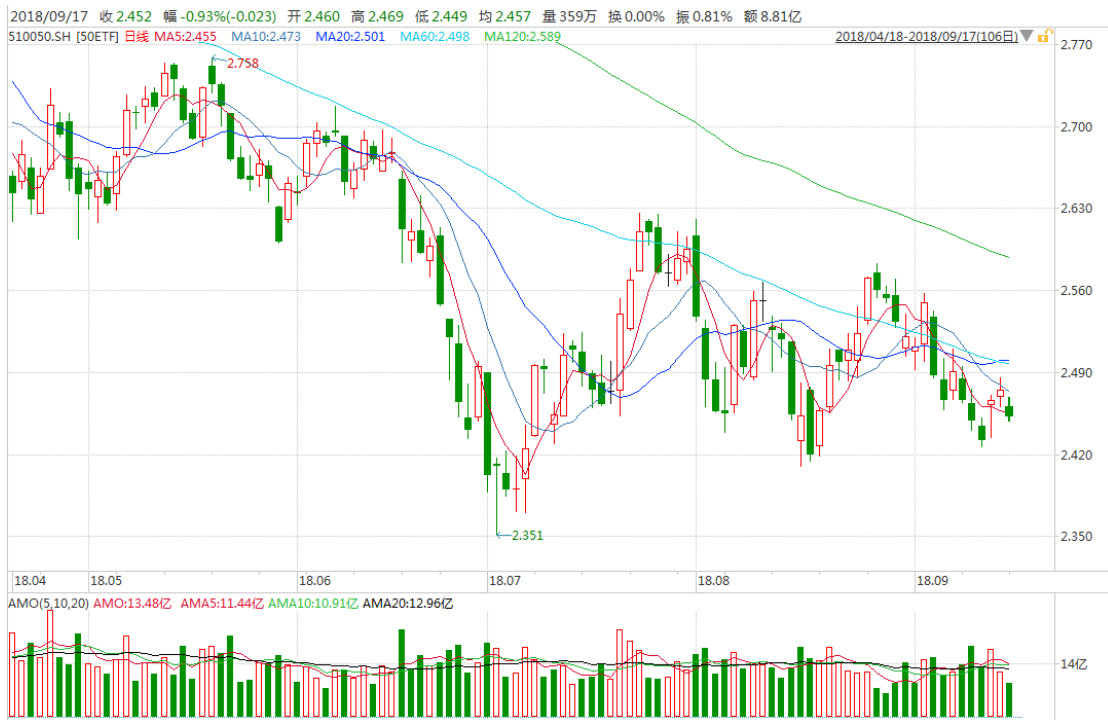
图表 2：上证 50ETF 日 K 线图