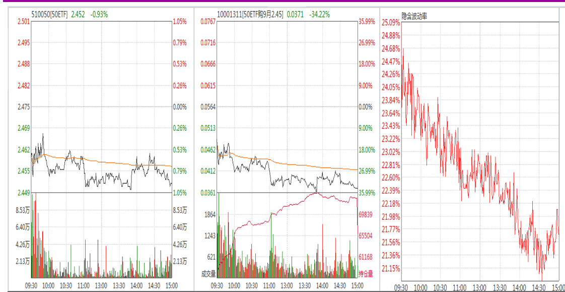
图表 8：50ETF 与 9 月平值认购期权“50ETF 购 9 月 2450”日内走势图及隐含波动率走势图