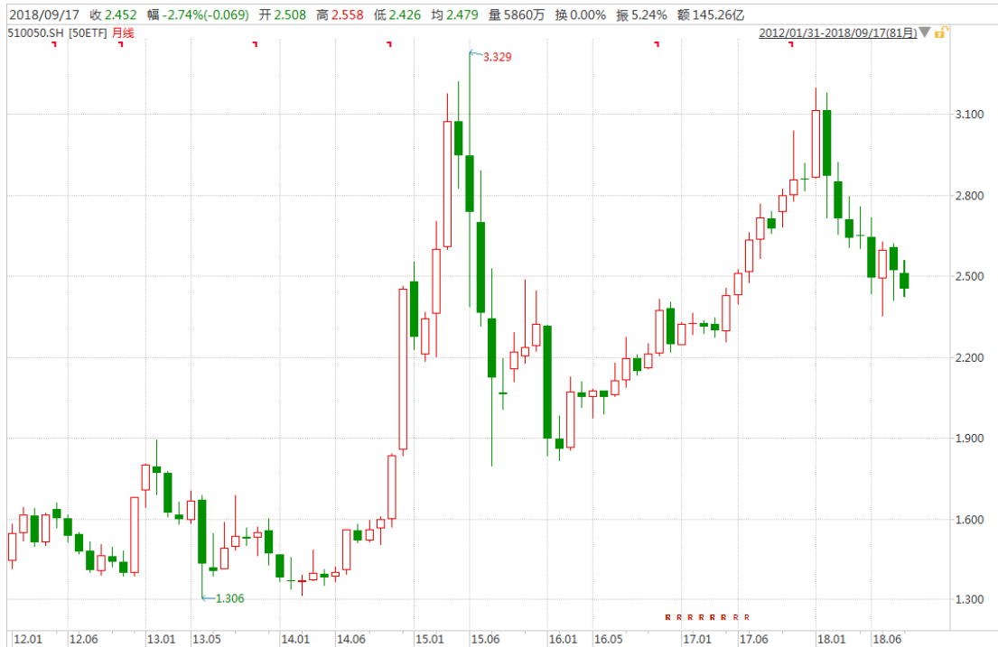
图表 4：上证 50ETF 月 K 线图

从以下的月 K 线图看，50ETF9 月份震荡下行，仍可关注 2.500 整数关口。