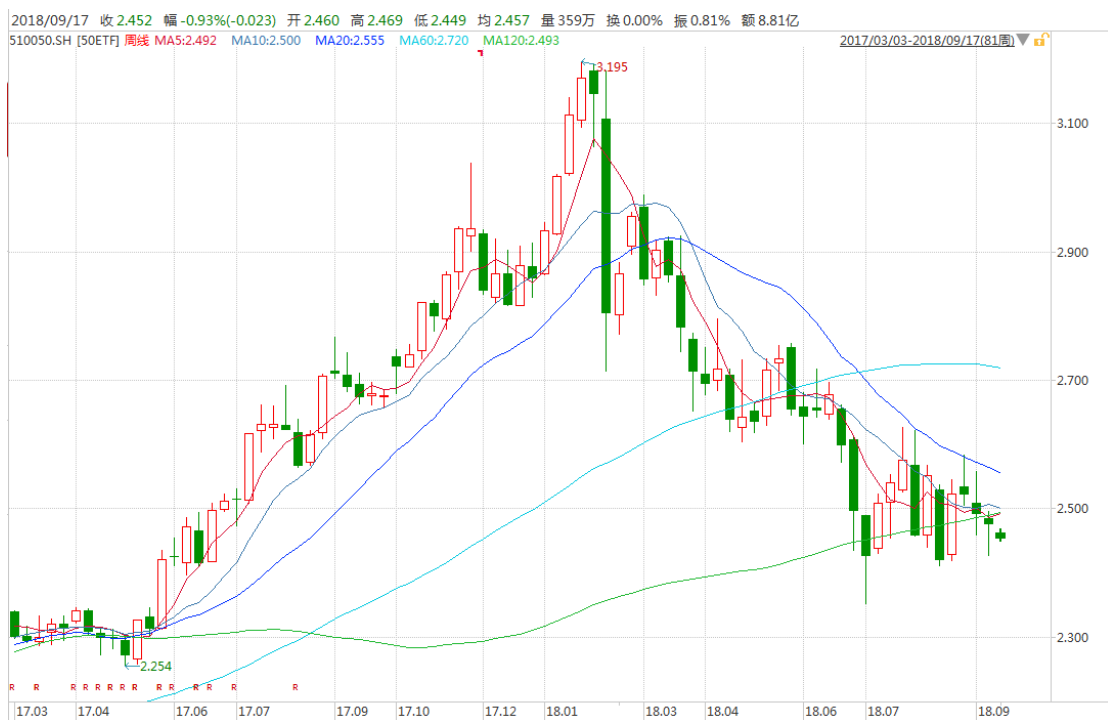
图表 3：上证 50ETF 周 K 线图