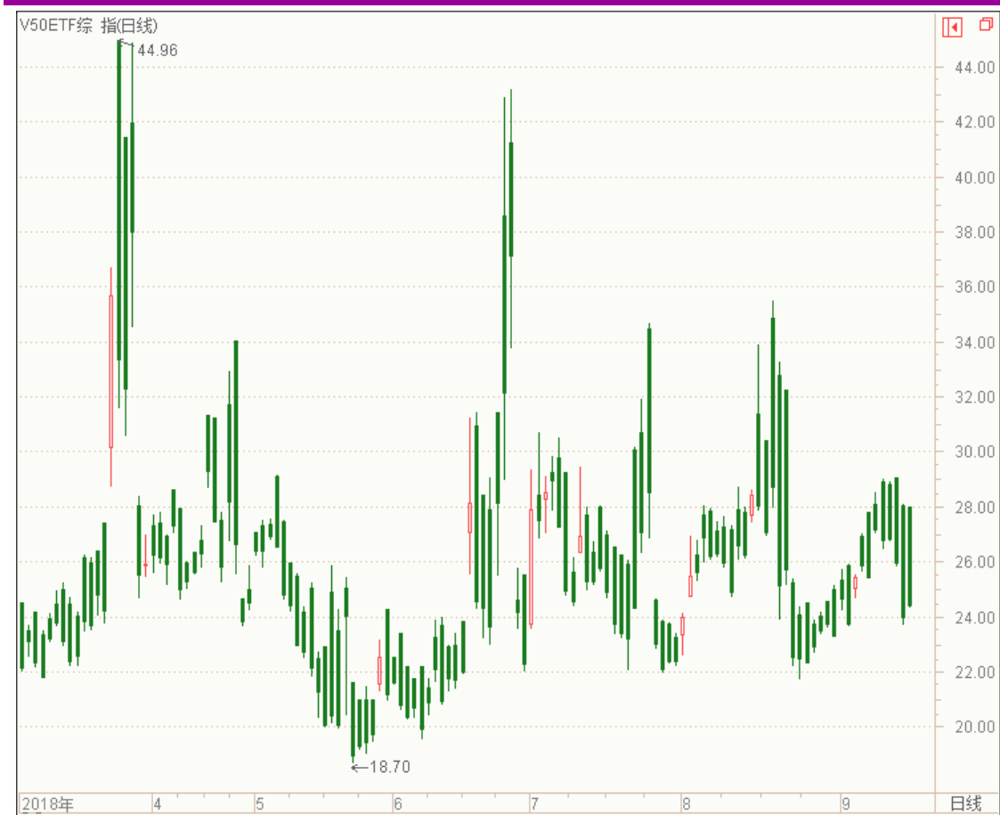
图表 11：来自汇点软件 V50ETF 综指隐含波动率变化图