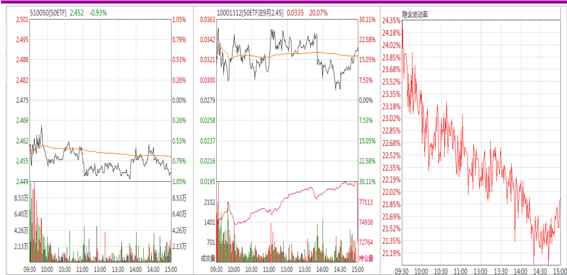
图表 9：50ETF 与 9 月平值认沽期权“50ETF 沽 9 月 2450”日内走势图及隐含波动率走势图