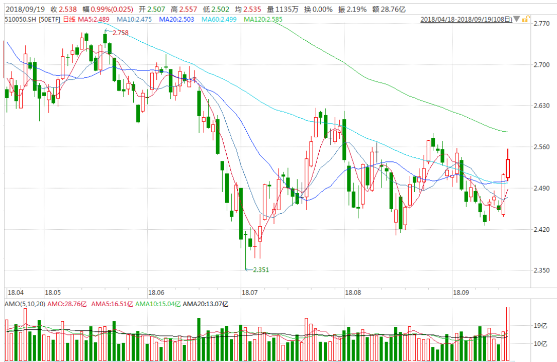
图表 2：上证 50ETF 日 K 线图

从下面的日 K 线图来看，50ETF 今日继续上涨，成交再度放大，留意 60 日均线。