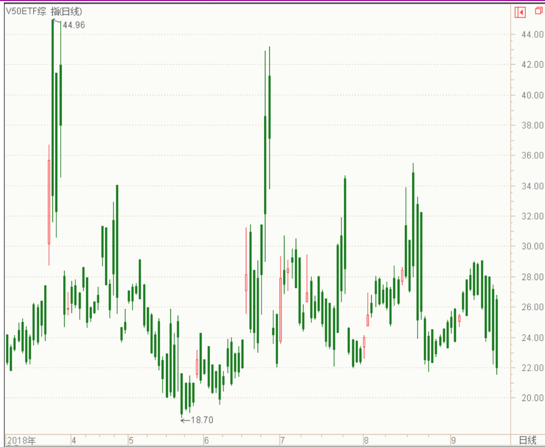
图表 11：来自汇点软件 V50ETF 综指隐含波动率变化图