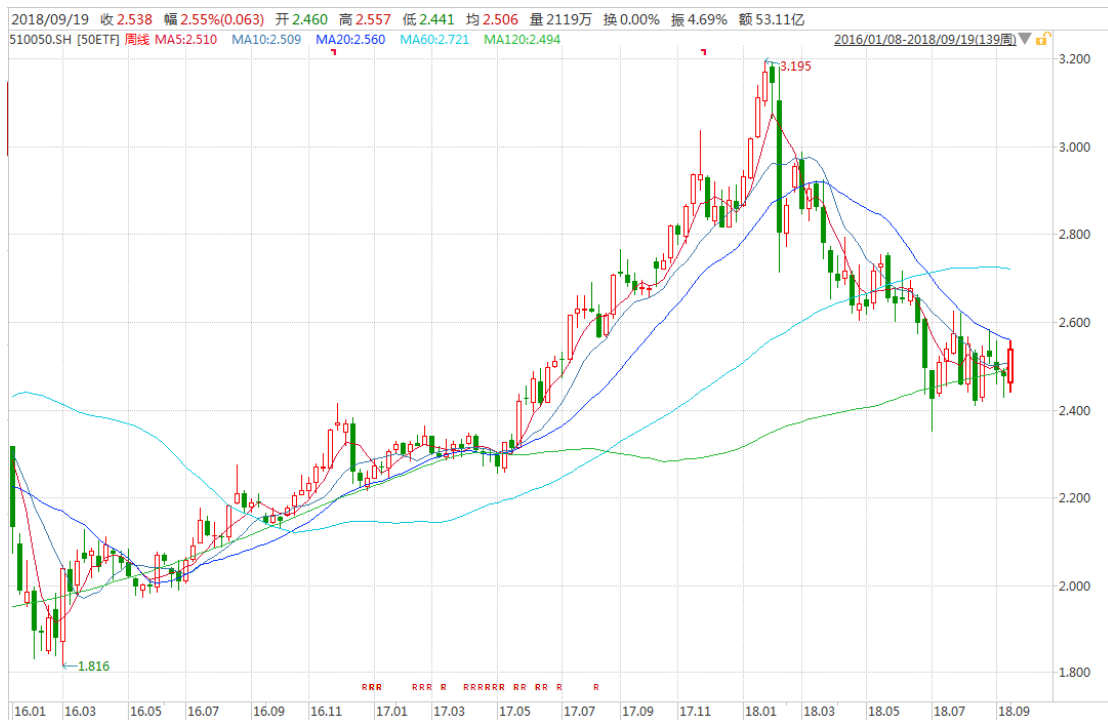
图表 3：上证 50ETF 周 K 线图