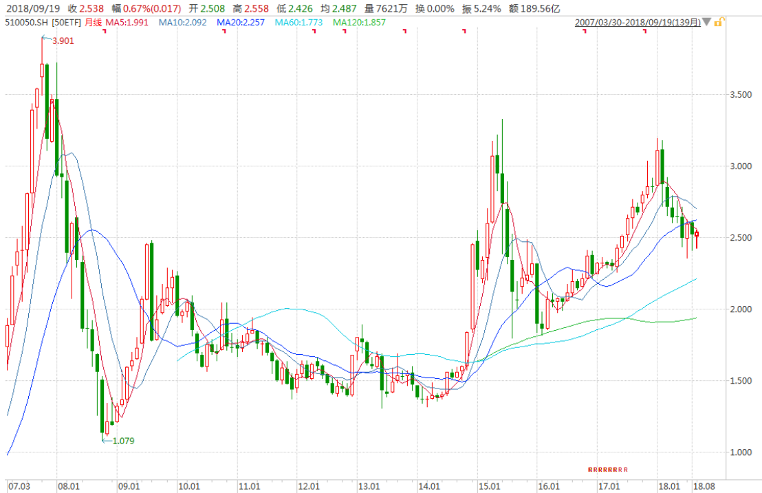
图表 4：上证 50ETF 月 K 线图

从以下的月 K 线图看，50ETF9 月份震荡上行，留意 2.500 关口是否站稳。