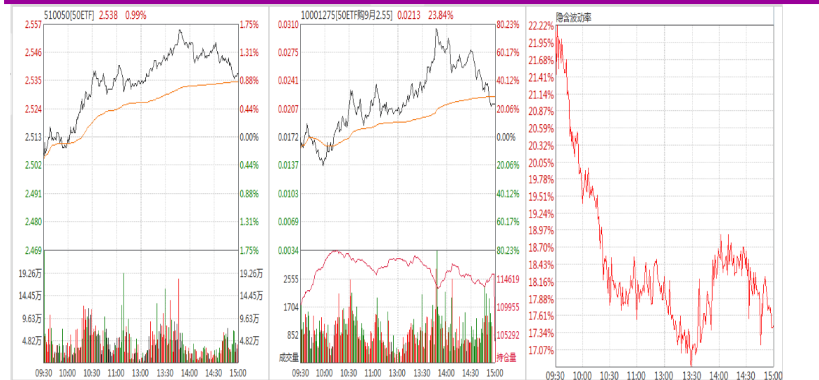
图表 8：50ETF 与 9 月平值认购期权“50ETF 购 9 月 2550”日内走势图及隐含波动率走势图