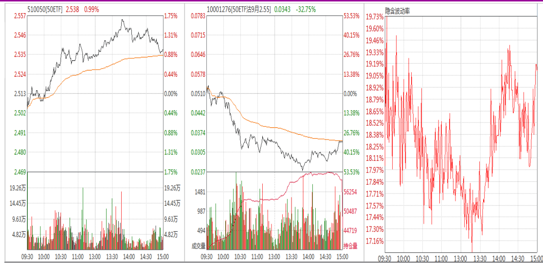
图表 9：50ETF 与 9 月平值认沽期权“50ETF 沽 9 月 2550”日内走势图及隐含波动率走势图