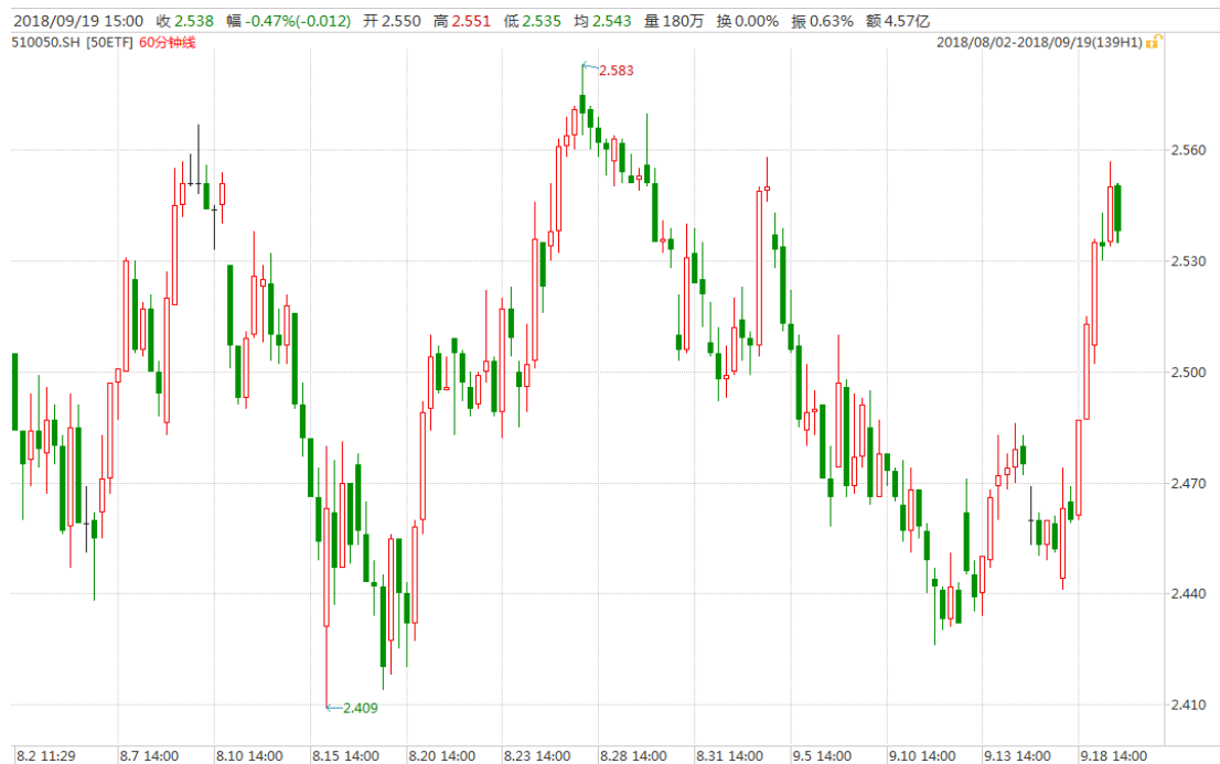
图表 1: 上证 50ETF 60 分钟 K 线图

从下面的 60 分钟图来看, 50ETF 震荡盘升, 已经临近前期震荡区间上沿。