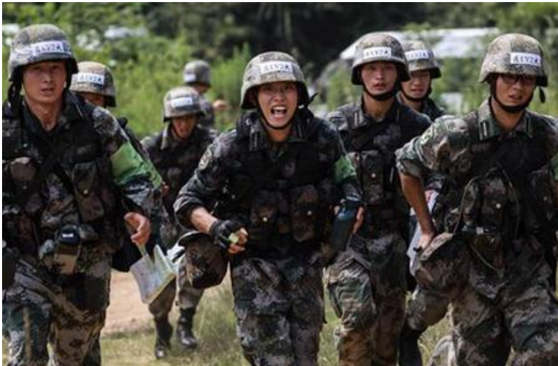
图 2：陆军“精武-2018”军事比武竞赛落幕

这次竞赛还引入北斗卫星导航定位系统、单兵激光模拟交战系统等部队信息化装备器材，突出对参赛队员信息素质、信息技能的考察，提高参赛队员依托信息化装备打仗的意识和能力。