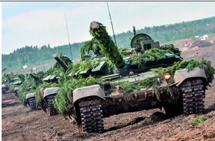
图 4：俄“东方-2018”大演习收官，新装备轮番出场

9月17日，被称为俄罗斯史上规模最大的“东方-2018”演习落下帷幕，参演部队开始返回常驻地。俄国防部长称，演习情况总结将于10月完成，不过这并没有妨碍媒体对这次超大规模演习品头论足。俄媒透露了演习使用的新式武器，而美媒认为，这次演习实际上比俄罗斯宣传的规模要小。中国专家表示，这次演习是对俄罗斯近年来军队建设的一次综合检验，体现了俄罗斯基于现有装备，打赢现实战争的综合能力。