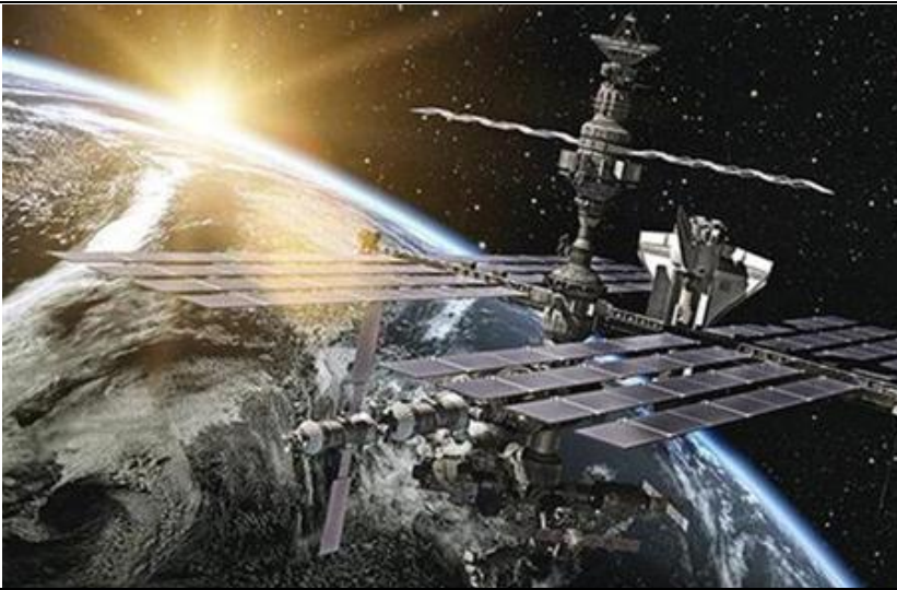
图 3：中国北斗将向全球用户提供遇险报警服务