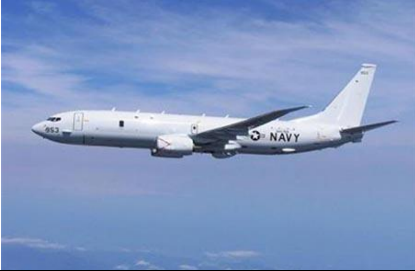
图 5：美国拟售韩 P-8A 反潜机和“爱国者”导弹

作为交易的一部分，韩国还将获得专为这种战机提供的战术无线电、导航设备和导弹预警传感器，出售 P-8A 巡逻机符合特朗普政府加强首尔实力的愿望。