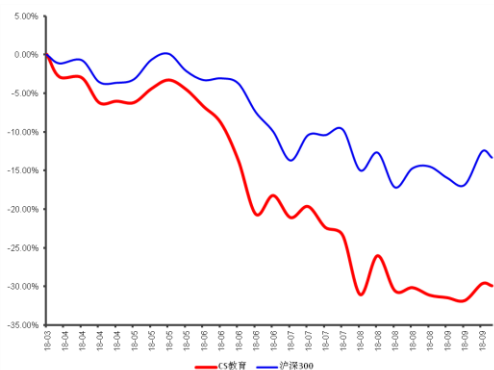
最近6个月行业指数与沪深300指数比较