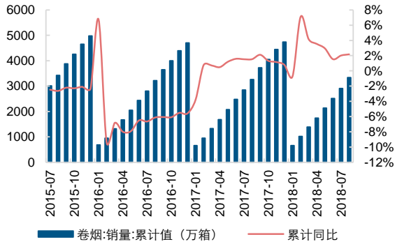
图 1：卷烟累计销量及同比