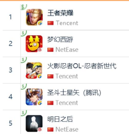
图 15: App Store 中国区畅销榜 TOP5

App Store 2018 年 11 月 23 日数据中国区畅销榜排名前三：腾讯游戏《王者荣耀》、网易《梦幻西游》和腾讯游戏《火影忍者 OL-忍者新世代》；腾讯游戏《圣斗士星矢》排名第四，网易《明日之后》排名第五。