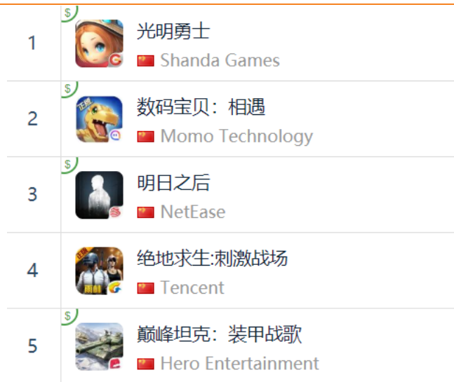
图 14: App Store 中国区免费榜 TOP5