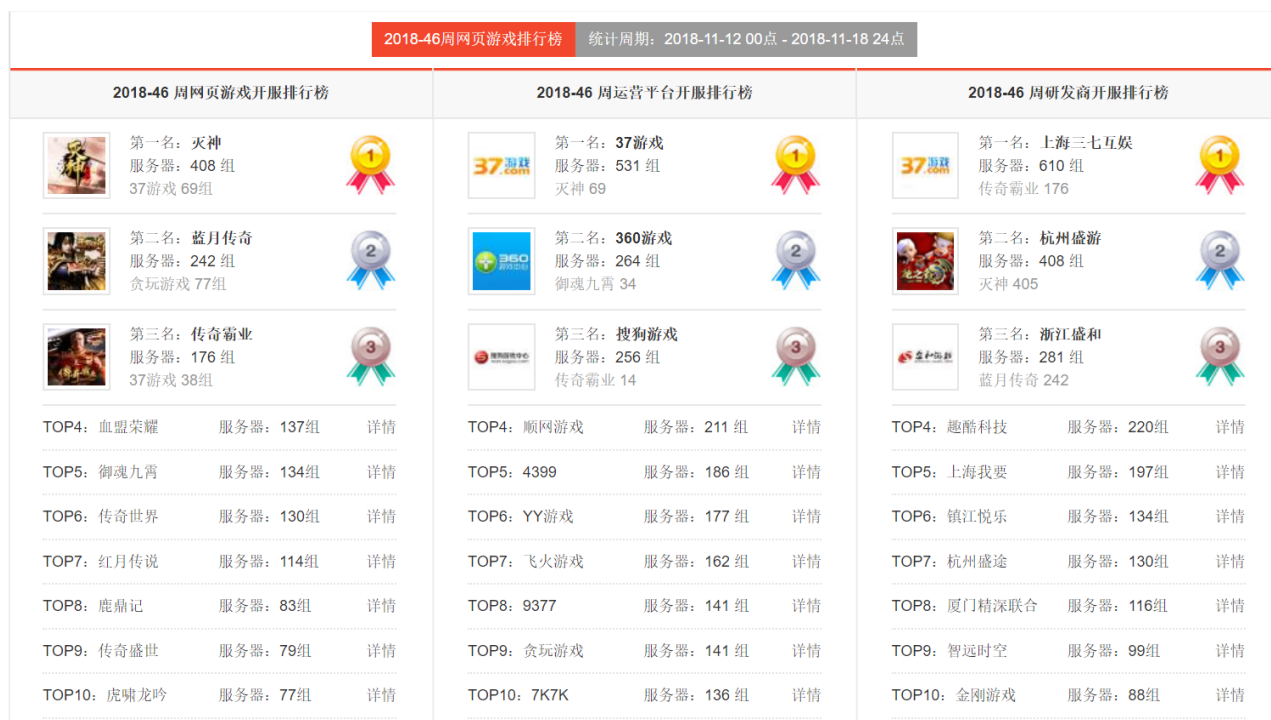
图 12: 网页游戏开服排行 (单位: 组)