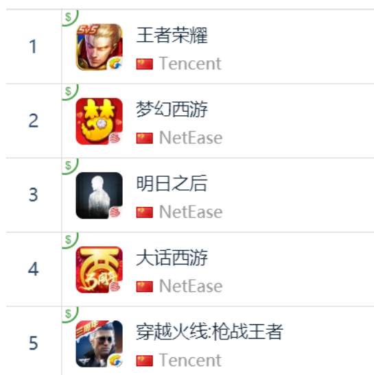
图 15：App Store 中国区畅销榜 TOP5

App Store 2018 年 11 月 30 日数据中国区畅销榜下载量排行前三： 腾讯游戏《王者荣耀》 ， 网易《梦幻西游》 ， 网易《明日之后》 ； 网易《大话西游》 排名第四， 腾讯游戏《穿越火线：枪战王者》 排名第五。