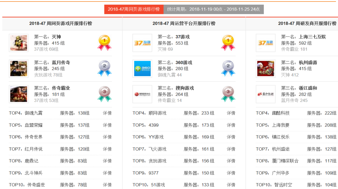
图 122：网页游戏开服排行（单位：组）