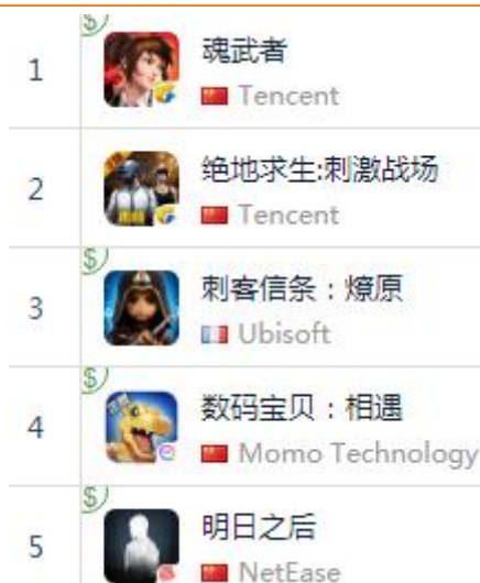
图 144：App Store 中国区免费榜 TOP5

App Store 2018 年 11 月 30 日数据中国区免费榜下载量排行前三： 腾讯游戏《魂武者》 、 腾讯游戏《绝地求生》 、 育碧《刺客信条：燎原》 ； 陌陌科技《数码宝贝：相遇》 排名第四， 网易《明日之后》 排名第五。