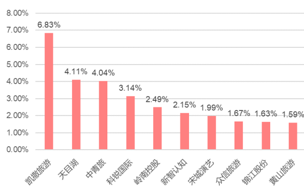
图 4：当日涨幅前十个股（%）