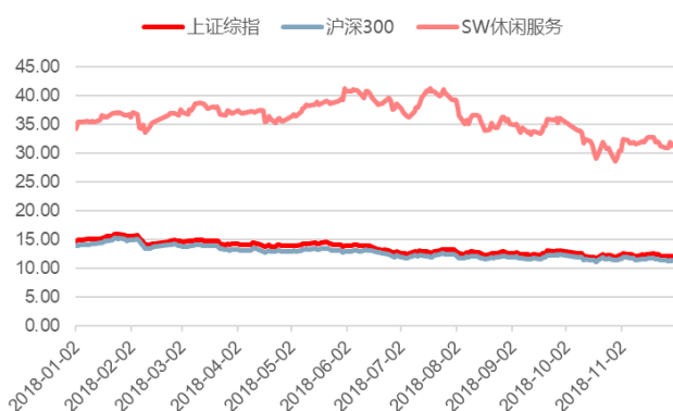
图 3：PE 估值水平变化