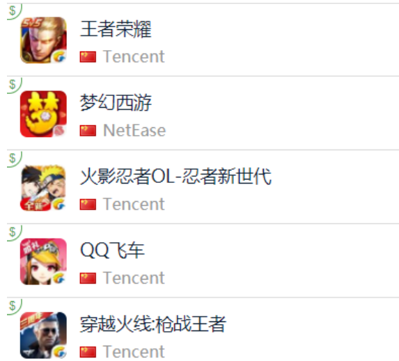
图 15：App Store 中国区畅销榜 TOP5

App Store 2018 年 12 月 7 日数据中国区畅销榜下载量排行前三： 腾讯《王者荣耀》 、 网易《梦幻西游》 、 腾讯《火影忍者 OL-忍者新时代》 ， 腾讯《QQ 飞车》 排名第四， 腾讯《穿越火线：枪战王者》 排名第五。