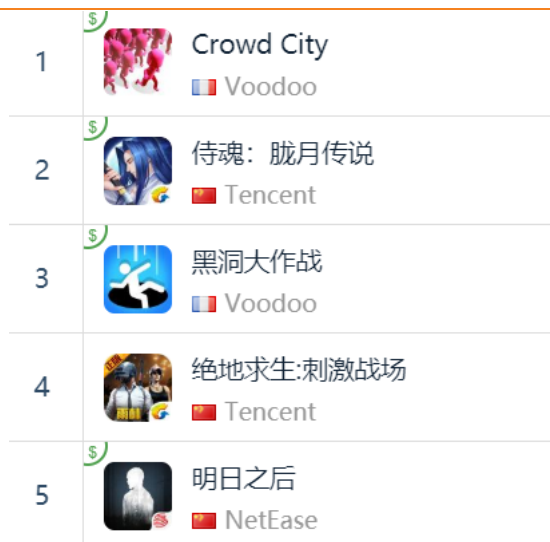
图 144: App Store 中国区免费榜 TOP5

App Store 2018年12月7日数据中国区免费榜下载量排行前三: Voodoo《拥挤城市》、腾讯游戏《侍魂: 胧月传说》、Voodoo《黑洞大作战》, 腾讯游戏《绝地求生: 刺激战场》排名第四, 网易《明日之后》排名第五。