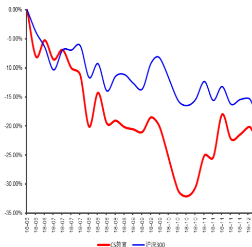
最近 6 个月行业指数与沪深 300 指数比较