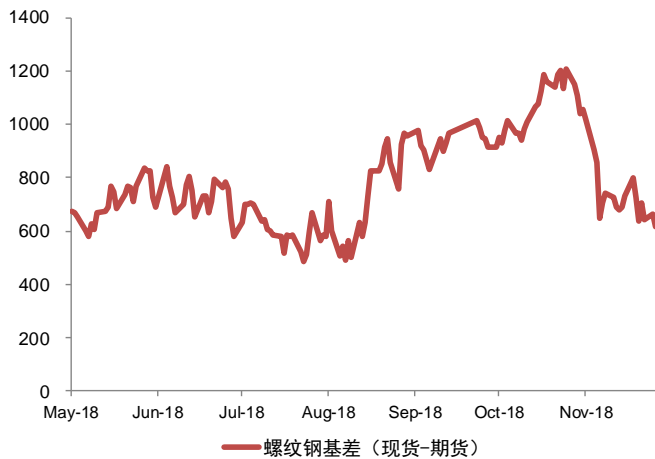
图表：螺纹基差监测