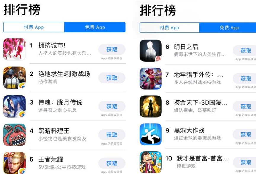
图表15: App Store 12月15日数据中国区免费榜排名前十

App Store 12月15日数据中国区免费榜排名前十:《拥挤城市》、《绝地求生:刺激战场》、《侍魂:胧月传说》、《黑暗料理王》、《王者荣耀》、《明日之后》、《地牢猎手外传:勇者战队》、《摸金天下》、《黑洞大作战》、《我才是首富》。