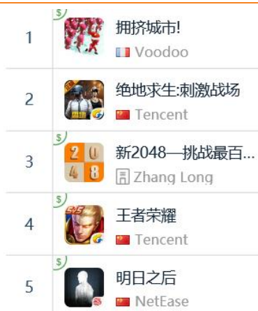
图 14：App Store 中国区免费榜 TOP5

App Store 2018年12月30日数据中国区免费榜下载量排行前三：Voodoo《拥挤城市!》、腾讯《绝地求生：刺激战场》、掌龙《新2048—挑战最百变数》，腾讯《王者荣耀》排名第四，网易《明日之后》排名第五。