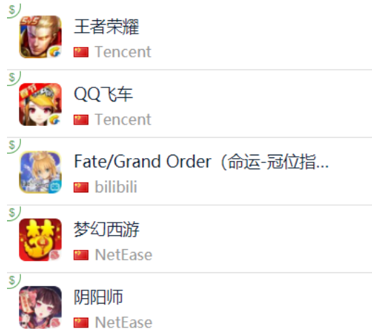
图 15: App Store 中国区畅销榜 TOP5