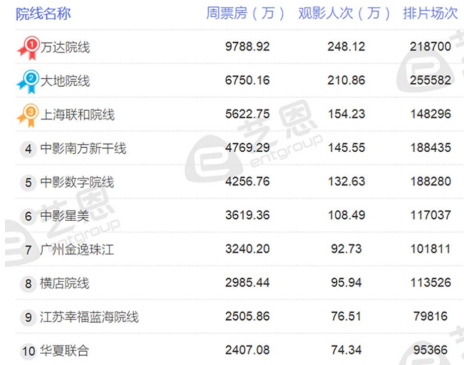
图 1：2019 年第 3 周（2019.1.21-2019.1.27）全国院线票房 TOP10