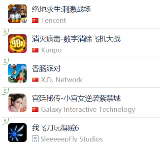
图 14: App Store 中国区免费榜 TOP5

App Store 2019 年 2 月 8 日数据中国区免费榜下载量排行前三: 腾讯《绝地求生: 刺激战 场》、Kunpo《消灭病毒-数字消除飞机大战》、心动网络《香肠派对》。