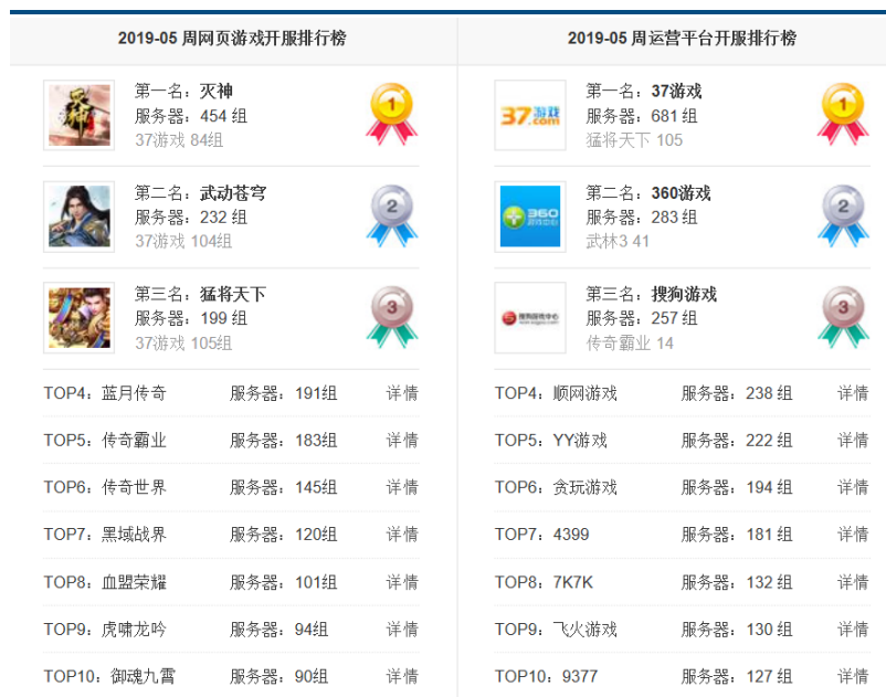
图表13： 网页游戏与运营平台开服排行