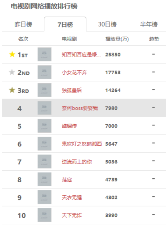
图表11：截至2月16日最近7日电视剧播放排行榜前十