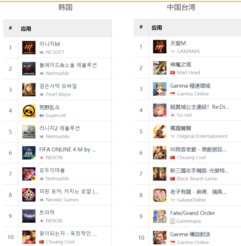
图 15：韩国及中国台湾市场 Google Play 游戏畅销榜排名

腾讯《极速领域》、创酷互动《叫我官老爷》、黑胡子发行《新三国志》、腾讯《传说对决》在中国台湾市场中排名第三、第六、第七、第十。